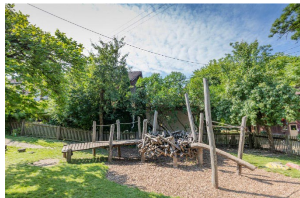
Bild 9 & 10: Mehrzweckraum und Garten der Denk mit Kita Starnberg Wangen

Die großzügigen Garderoben- und der Eingangsbereich bietet den Eltern, Kindern und Geschwisterkindern in der Einrichtung einen Raum, um sie willkommen zu heißen. Hier werden die Garderoben der Kinder untergebracht und die pädagogischen Fachkräfte können im täglichen Betrieb die kleinen Schützlinge und deren Eltern in Empfang nehmen und gegebenenfalls auch eine kurze Rücksprache mit den Eltern halten. Zusätzlich werden in diesem Bereich Infotafeln angebracht, an welchen die Eltern aktuelle Informationen unserer Einrichtung einsehen können.