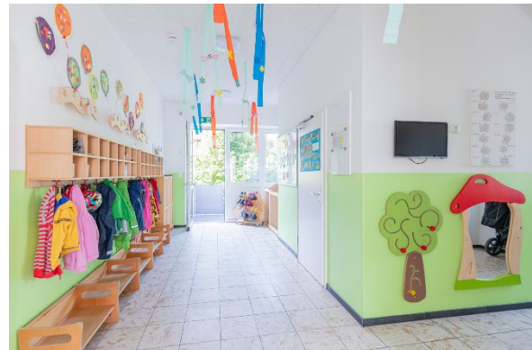
Bild 4 & 5: Raumgestaltung unserer Denk mit Kita Starnberg Wangen

Die räumliche Ausstattung und Ausgestaltung orientierten sich an den Bedürfnissen der uns anvertrauten Säuglinge, Kleinkinder und Kinder. Gemeinsames Spielen ist ebenso möglich wie vorübergehender Rückzug. Das Bedürfnis nach aktiver körperlicher Bewegung kann ebenso erfüllt werden, wie der Wunsch des Kindes nach Kontaktaufnahme zum pädagogischen Fachpersonal und einem gemeinsamen Spiel und Dialog. Damit sich die Kinder gut orientieren, in der Eingewöhnungszeit Vertrauen aufbauen und Vertrautes wiedererkennen können, ist die gute Strukturierung der Gruppenräume Grundlage.