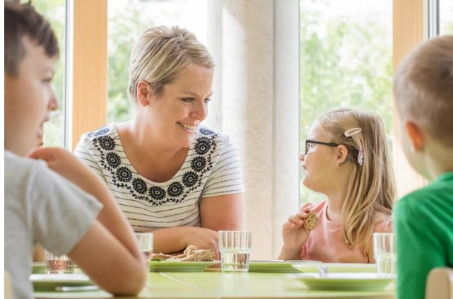
Bild: Pädagogin mit Kind

Wir nehmen uns Zeit für die Familien. Uns ist es wichtig, dass sich unsere Familien genauso wohl fühlen wie die Kinder. Der tägliche kurze Austausch und das persönliche Gespräch sollen Vertrauen schaffen und ihnen die Sicherheit geben, dass es ihrem Kind bei uns gut geht. Das Kind fühlt sich durch den engen Kontakt zwischen Familien und pädagogischen Fachkräften geborgen und es fasst Vertrauen in die neue Umgebung. So kann es mit Unterstützung des pädagogischen Fachpersonals seinen Platz in der Kindergruppe finden.