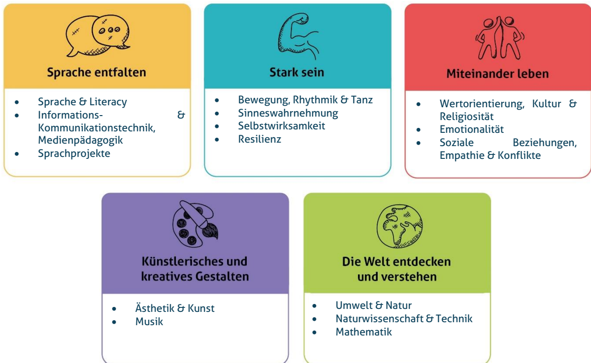
Abbildung 1: Die fünf Erfahrungsbereiche von MiniMax Kids Kita für eine ganzheitliche Bildung

Diese werden individuell auf alle Altersgruppen der von uns zu betreuenden Kinder angepasst und unter einem extra Gliederungspunkt näher beschrieben. Unsere Kita gestaltet durch vielfältige Angebote ein geeignetes Lernumfeld, damit unsere Kinder Basiskompetenzen erwerben und weiterentwickeln können.