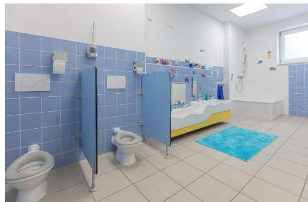
Bild 7 & 8: Gruppenraum und Kinderbad in der Denk mit Kita Zorneding