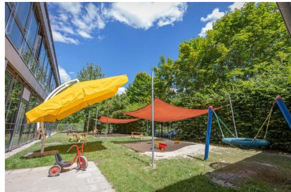
Bild 9 & 10: Mehrzweckraum und Garten der Denk mit Kita Unterschleißheim, Microcity

Außerdem sind an einem Whiteboard die Fotos des pädagogischen Fachpersonals aufgehängt, so dass sich alle Eltern schnell und einfach ein Bild von den Fachkräften machen können und damit auch ihren Ansprechpartner schnell erkennen können. Die Teamtafel bietet auch eine gute Gelegenheit Vertrauen in das Personal zu legen, auch z. B. wenn Springer oder Praktikanten im Haus sind.