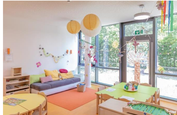
Bild 4 & 5: Raumgestaltung unserer Denk mit Kita Unterschleißheim, Microcity

Die räumliche Ausstattung und Ausgestaltung orientierten sich an den Bedürfnissen der uns anvertrauten Säuglinge, Kleinkinder und Kinder. Gemeinsames Spielen ist ebenso möglich wie vorübergehender Rückzug. Das Bedürfnis nach aktiver körperlicher Bewegung kann ebenso erfüllt werden, wie der Wunsch des Kindes nach Kontaktaufnahme zum pädagogischen Fachpersonal und einem gemeinsamen Spiel und Dialog. Damit sich die Kinder gut orientieren, in der Eingewöhnungszeit Vertrauen aufbauen und Vertrautes wiedererkennen können, ist die gute Strukturierung der Gruppenräume Grundlage.