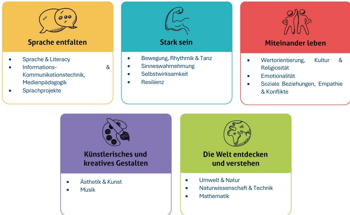
Abbildung 1: Die fünf Erfahrungsbereiche von Denk mit Kita für eine ganzheitliche Bildung

Diese werden individuell auf alle Altersgruppen der von uns zu betreuenden Kinder angepasst und unter einem extra Gliederungspunkt näher beschrieben. Unsere Kita gestaltet durch vielfältige Angebote ein geeignetes Lernumfeld, damit unsere Kinder Basiskompetenzen erwerben und weiterentwickeln können.