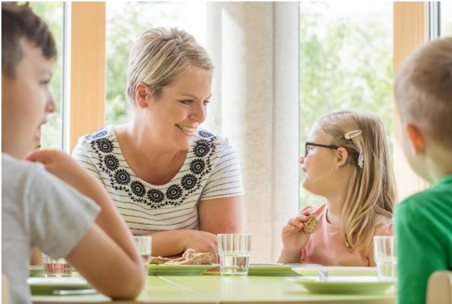
Bild: Pädagogin mit Kind

Wir führen in der Trennungsphase feste Rituale für das Kind ein. Das kann das tägliche Winken am Fenster sein, das Mitbringen eines vertrauten Spielzeugs, eines Kuscheltiers oder das Singen eines Liedes. Oft helfen auch unterstützende Dinge wie der Schnuller oder das Lieblingstuch, um den Übergang von Vertrautem zu Neuem zu erleichtern. Die Verabschiedung fällt dem Kind leichter, wenn sie kurz, aber trotzdem liebevoll ist. Auch vielen Familien fällt der Abschied schwer. Das persönliche Übernehmen des