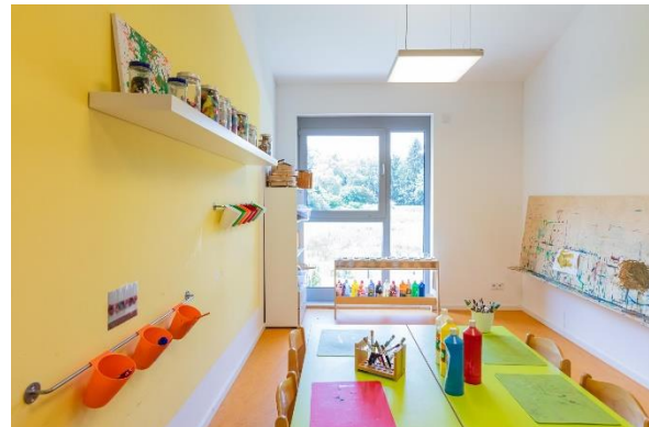
Bild 4 & 5: Raumgestaltung unserer Denk mit Kita Tutzing Kampberg

Die räumliche Ausstattung und Ausgestaltung orientierten sich an den Bedürfnissen der uns anvertrauten Säuglinge, Kleinkinder und Kinder. Gemeinsames Spielen ist ebenso möglich wie vorübergehender Rückzug. Das Bedürfnis nach aktiver körperlicher Bewegung kann