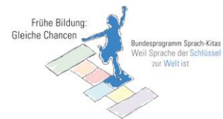
Bild: Sprach-Kita 1

Auch nach offiziellem Ende des Programms werden die Säulen der Sprach-Kita beibehalten und als wichtiger Bestandteil unserer pädagogischen Arbeit verankert.