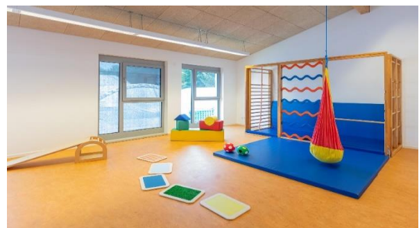
Bild 9 & 10: Garten und Mehrzweckraum der Denk mit Kita Tutzing Kampberg