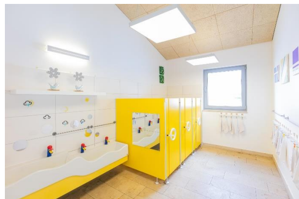
Bild 7 & 8: Gruppenraum und Kinderbad in der Denk mit Kita Tutzing Kampberg

Die Krippengruppen befinden sich im Erdgeschoß und besitzen jeweils einen Gruppenraum mit angeschlossenen Schlafräumen. Der Krippenteppich „Circelino“ dient im Gruppenraum als täglicher Treffpunkt für den Morgenkreis. Auf seinen zwölf Punkten findet jedes Kind einen Platz und gemeinsam kann im Morgenkreis der Tag mit Fingerspielen, Liedern und dem gemeinsamen Zählen der Kinder begonnen werden.