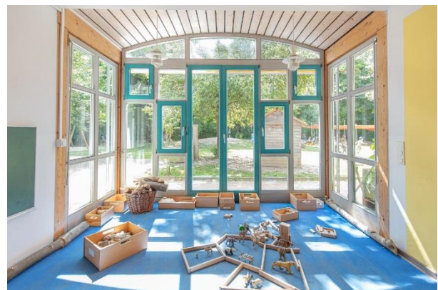
Bild 7 & 8: Gruppenraum und Bauecke in der Denk mit Kita Schwabhausen, Agricolastraße

Der Der Kindergarten verfügt über fünf Gruppenräume mit jeweils einem Nebenraum. Diese können in unterschiedlichster Form genutzt werden.