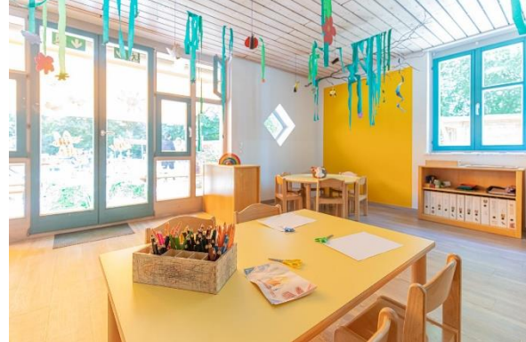
Bild 4 & 5: Raumgestaltung unserer Denk mit Kita Schwabhausen, Agricolastraße

Die räumliche Ausstattung und Ausgestaltung orientierten sich an den Bedürfnissen der uns anvertrauten Kinder. Gemeinsames Spielen ist ebenso möglich wie vorübergehender Rückzug. Das Bedürfnis nach aktiver körperlicher Bewegung kann ebenso erfüllt werden, wie der Wunsch des Kindes nach Kontaktaufnahme zum pädagogischen Fachpersonal und einem gemeinsamen Spiel und Dialog. Damit sich die Kinder gut orientieren, in der Eingewöhnungszeit Vertrauen aufbauen und Vertrautes wiedererkennen können, ist die gute Strukturierung der Gruppenräume Grundlage.