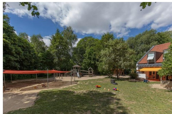
Bild 9 & 10: Mehrzweckraum und Garten der Denk mit Kita Schwabhausen, Agricolastraße

Im Untergeschoss der Einrichtung befindet sich unsere Turnhalle. Hier haben die Kinder Freiraum zum Toben und Spielen. Hierfür werden den Kindern die unterschiedlichsten Materialien zur Verfügung gestellt. Natürlich gehören hierzu klassische Balancierelemente, Springseile, Jongliermaterialien und Bälle.