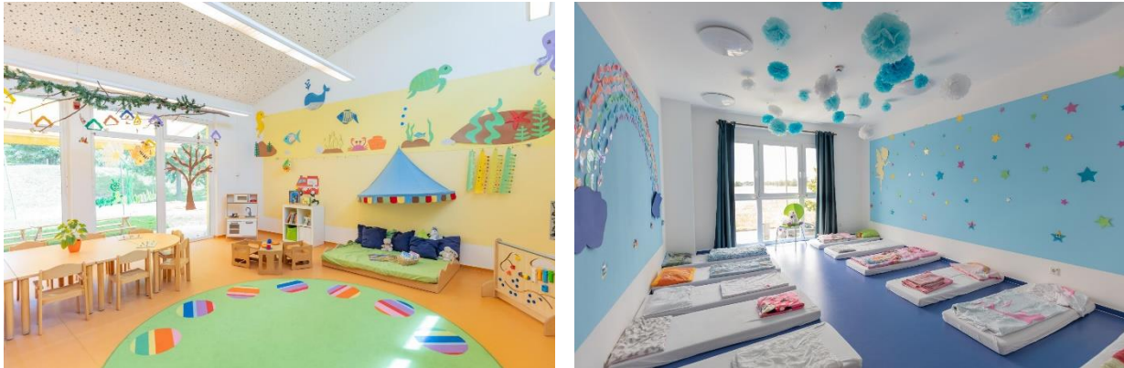
Bild 7 & 8: Gruppenraum und Schlafräum in der Denk mit Kita Olching Esting

Neben Alltags- und Naturmaterialien, wie beispielsweise runde und eckige Holzklötze, Siebe, Dosen, Tücher, Baumscheiben, Metallschalen, Kartons und mehr für freies Experimentieren bieten die Räume sinnvolle Erfahrungszugänge, die sie zu eigenaktivem Handeln anregen.