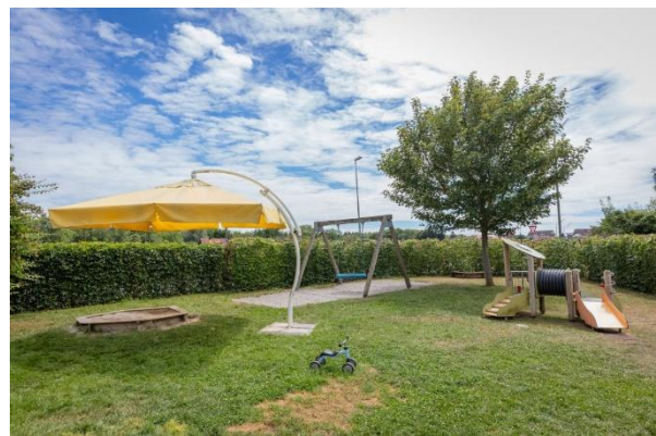
Bild 9 & 10: Bewegungsraum und Garten der Denk mit Kita Olching Esting