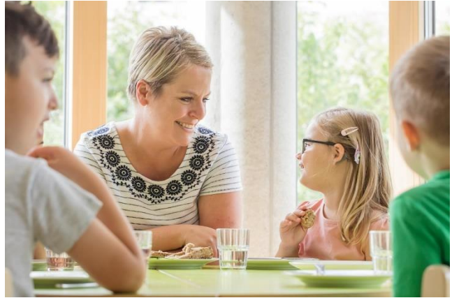
Bild: Pädagogin mit Kind

Der erste Tag in der Kinderkrippe ist für die Kinder und Familien ein wichtiges Ereignis und ist meist der Beginn eines neuen Lebensabschnitts. In vielen Familien bedeutet es für das Kind die erste Trennung vom Elternhaus. In dieser Zeit ist es für Kinder und Familien wichtig, sich an die neue Situation zu gewöhnen. Diese Erfahrung beeinflusst weitere Neuanfänge im Leben. Unser Ziel in der Eingewöhnung ist es , Familien und Kind in langsamen Schritten an den Alltag in unserer Kindergruppe heranzuführen und damit vertraut werden zu lassen.