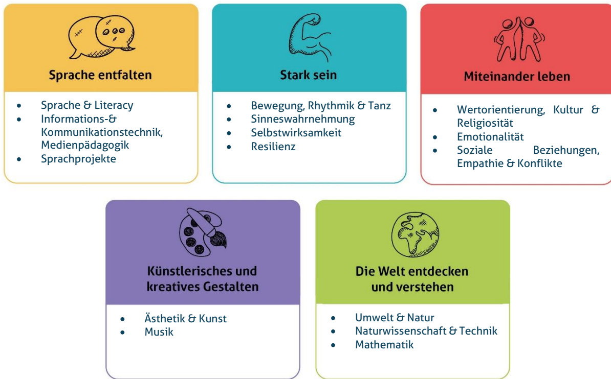
Abbildung 1: Die fünf Erfahrungsbereiche von Denk mit Kita für eine ganzheitliche Bildung

Diese werden individuell auf alle Altersgruppen der von uns zu betreuenden Kinder angepasst und unter einem extra Gliederungspunkt näher beschrieben. Unsere Kita gestaltet durch vielfältige Angebote ein geeignetes Lernumfeld, damit unsere Kinder Basiskompetenzen erwerben und weiterentwickeln können.