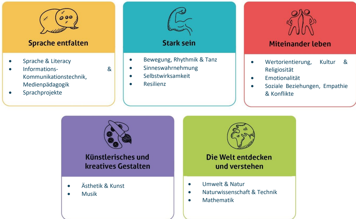
Abbildung 1: Die fünf Erfahrungsbereiche von Denk mit Kita für eine ganzheitliche Bildung

Diese werden individuell auf alle Altersgruppen der von uns zu betreuenden Kinder angepasst und unter einem extra Gliederungspunkt näher beschrieben. Unsere Kita gestaltet durch vielfältige Angebote ein geeignetes Lernumfeld, damit unsere Kinder Basiskompetenzen erwerben und weiterentwickeln können.