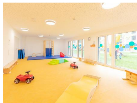
Bild 4 & 5: Garten und Mehrzweckraum unserer Denk mit Kita Nürnberg

In der Einrichtung befindet sich zudem ein großer Mehrzweckraum mit einer Fläche von ca. 66,41 m 2 . Dieser wird von den Kindern als Turnhalle für viele Bewegungsangebote genutzt und bietet so den Kindern eine zusätzliche Möglichkeit zum Toben und Spielen.