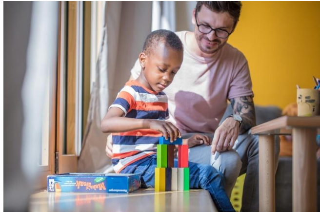
Bild: Pädagoge mit Kind in einer Denk mit Kita

Kinder zeigen schon sehr früh, welche Verhaltensweisen, Situationen, Personen oder Gegenstände sie besonders gernhaben. Diese individuellen Vorlieben zu beobachten und zu stärken, ist Aufgabe unseres pädagogischen Fachpersonals. Wir setzen Vertrauen in die kindliche Neugier und stärken die fragende Haltung der Kinder. Wir unterstützen die Kinder mit wertschätzender Bestätigung, mit emotionalem Rückhalt, mit praktischer Hilfestellung oder mit gezielten Hinweisen. Zudem können die pädagogischen Fachkräfte den Kindern wertvolle Impulse im Freispiel geben, um das Spiel der Kinder zu lenken und stärkend weiterzuentwickeln. Unsere Pädagogen sind Vorbilder bei Konflikt- und Grenzsetzungssituationen im sozialen Geschehen, an denen sich die Kinder im Spiel orientieren können. Jedes Kind signalisiert auf seine Weise, wie viel und welche Art der Unterstützung es benötigt. Jede Entwicklungsphase stellt einen wichtigen Zwischenschritt auf dem Weg zur