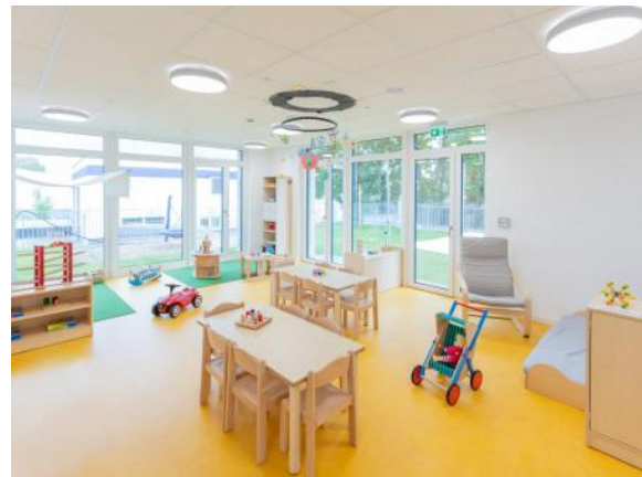
Bild 2 & 3: Kinderbad und Gruppenraum in unserer Denk mit Kita Nürnberg