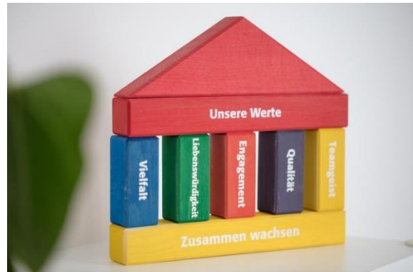
Bild: Unternehmenswerte von Denk mit Kita

Deswegen haben wir uns als Denk mit Kita nicht nur die Werte Engagement und Liebenswürdigkeit vorgenommen, die im Einflussbereich der einzelnen Person liegen, sondern auch den Wert Teamgeist, weil wir der Überzeugung sind, dass die Qualität unserer Arbeit nur im Team erhalten und ausgebaut werden kann. Ein gut funktionierendes, eingespieltes Team wiederum besteht aus engagierten und liebenswürdigen Teammitgliedern, die sich mit diesen Eigenschaften und ihren persönlichen Kompetenzen und Ressourcen eigenverantwortlich in das Team einbringen.