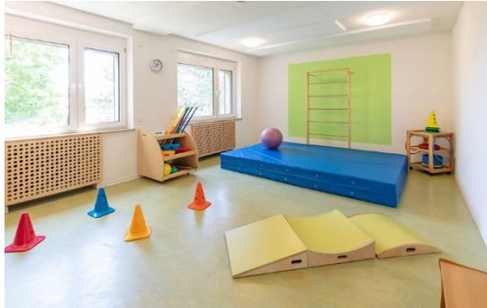
Bild 4 & 5: Bewegungsraum und Außenbereich der Denk mit Kita Neuhausen ob Eck