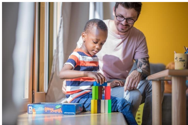
Bild: Pädagoge mit Kind in einer Denk mit Kita