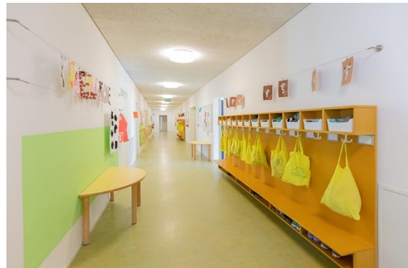
Bild 1, 2 & 3: Außenansicht, Kinderbad und Garderobenbereich der Denk mit Kita Neuhausen ob Eck

Außerdem gibt es im Erdgeschoss noch einen Bewegungsraum, in dem die verschiedensten Bewegungsangebote stattfinden. Auch der lange Flur lädt zum Austoben und Spielen ein.