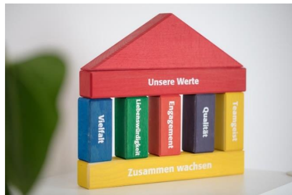
Bild: Unternehmenswerte von Denk mit Kita

Deswegen haben wir uns als Denk mit Kita nicht nur die Werte Engagement und Liebenswürdigkeit vorgenommen, die im Einflussbereich der einzelnen Person liegen, sondern auch den Wert Teamgeist, weil wir der Überzeugung sind, dass die Qualität unserer Arbeit nur im Team erhalten und ausgebaut werden kann. Ein gut funktionierendes, eingespieltes Team wiederum besteht aus engagierten und liebenswürdigen Teammitgliedern, die sich mit diesen Eigenschaften und ihren persönlichen Kompetenzen und Ressourcen eigenverantwortlich in das Team einbringen.