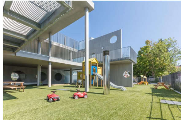
Bild 11 & 12: Raumgestaltung unserer Denk mit Kita Germering, Untere Bahnhofstraße

Die räumliche Ausstattung und Ausgestaltung orientierten sich an den Bedürfnissen der uns anvertrauten Säuglinge, Kleinkinder und Kinder. Gemeinsames Spielen ist ebenso möglich wie vorübergehender Rückzug. Das Bedürfnis nach aktiver körperlicher Bewegung kann ebenso erfüllt werden, wie der Wunsch des Kindes nach Kontaktaufnahme zum pädagogischen Fachpersonal und einem gemeinsamen Spiel und Dialog. Damit sich die Kinder gut orientieren, in der Eingewöhnungszeit Vertrauen aufbauen und Vertrautes wiedererkennen können, ist die gute Strukturierung der Gruppenräume Grundlage.