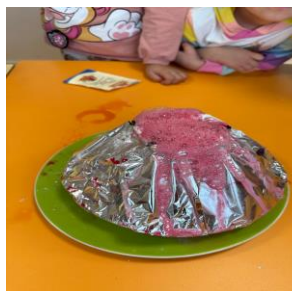
Bild 14: Experiment