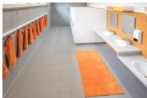
Bild 9 & 10: Atelier und Kinderbad der Denk mit Kita Germering, Untere Bahnhofstraße