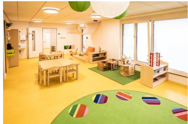
Bild 7 & 8: Gruppenräume in der Denk mit Kita Germering, Untere Bahnhofstraße