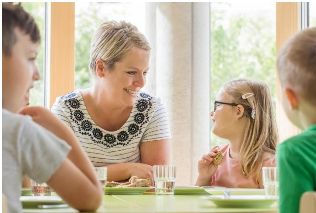
Bild: Pädagogin mit Kind

Nun kann die Zeit, in der das Kind allein in der Gruppe ist, langsam gesteigert werden. Ziel ist es, dass sich das Kind mit seinem eigenen Tempo auf die neue Umgebung, das pädagogische Fachpersonal und die anderen Kinder einstellen kann.