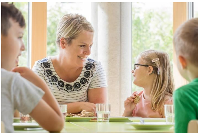
Bild: Pädagogin mit Kind

Nun kann die Zeit, in der das Kind allein in der Gruppe ist, langsam gesteigert werden. Ziel ist es, dass sich das Kind mit seinem eigenen Tempo auf die neue Umgebung, das pädagogische Fachpersonal und die anderen Kinder einstellen kann.