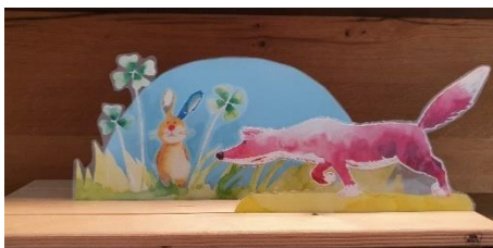
Bild: Sprach-Kita 5 Erzählschiene