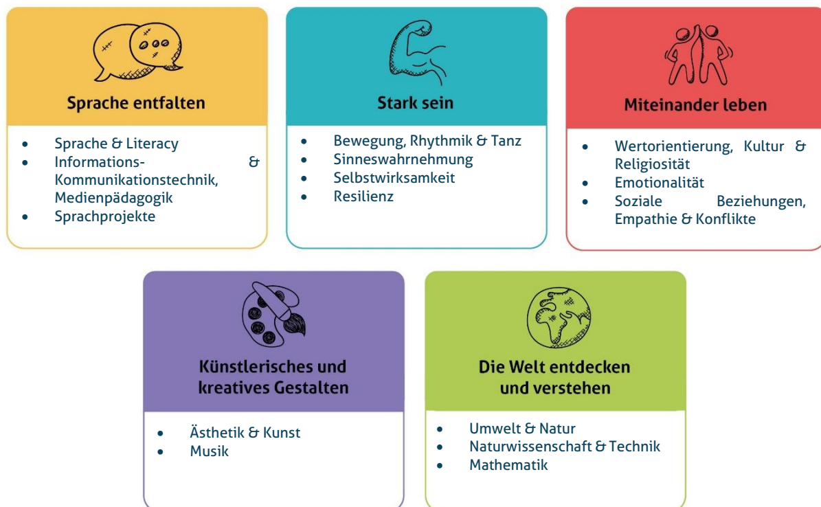
Abbildung 1: Die fünf Erfahrungsbereiche von Denk mit Kita für eine ganzheitliche Bildung

Diese werden individuell auf alle Altersgruppen der von uns zu betreuenden Kinder angepasst und unter einem extra Gliederungspunkt näher beschrieben. Unsere Kita gestaltet durch vielfältige Angebote ein geeignetes Lernumfeld, damit unsere Kinder Basiskompetenzen erwerben und weiterentwickeln können.