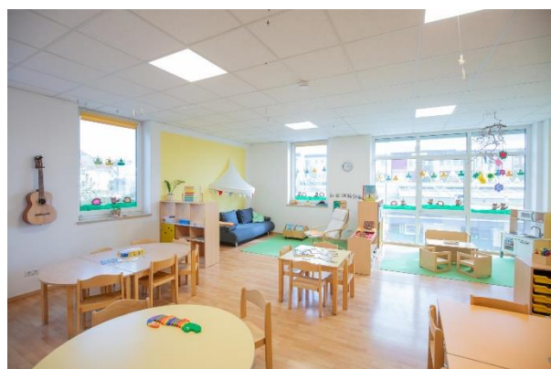
Bild 6 & 7: Raumgestaltung unserer Denk mit Kita Germering, Frühlingstraße

Die räumliche Ausstattung und Ausgestaltung orientierten sich an den Bedürfnissen der uns anvertrauten Säuglinge, Kleinkinder und Kinder. Gemeinsames Spielen ist ebenso möglich wie vorübergehender Rückzug. Das Bedürfnis nach aktiver körperlicher Bewegung kann