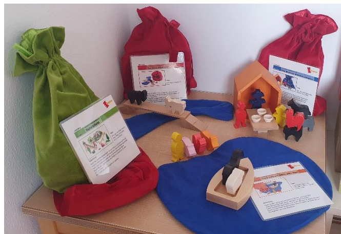
Bild: Sprach-Kita 6 Geschichtensäckchen