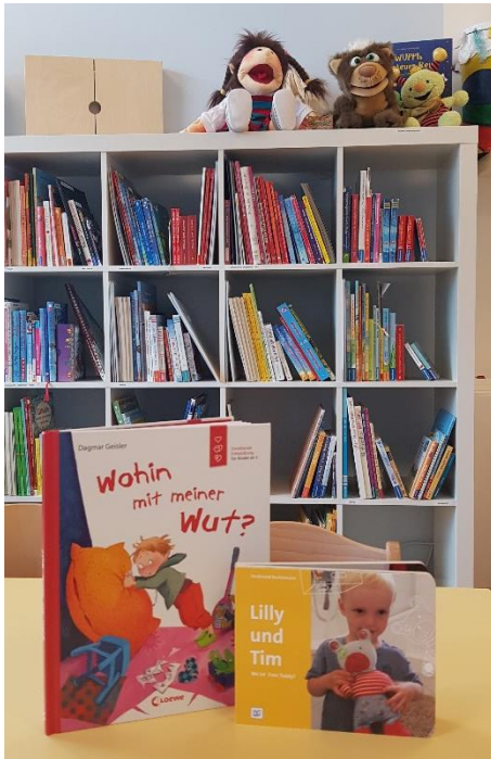
Bild: Sprach-Kita 4 Kindergartenbücherei