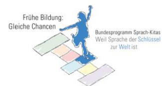
Bild: Sprach-Kita 1

Auch nach offiziellem Ende des Programms werden die Säulen der Sprach-Kita beibehalten und als wichtiger Bestandteil unserer pädagogischen Arbeit verankert.