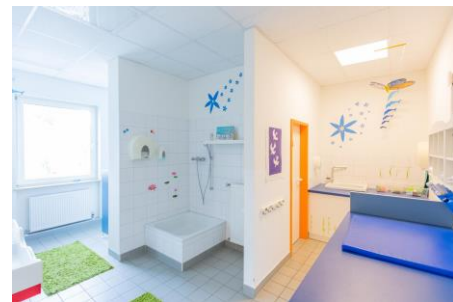
Bild 4: Badezimmer unserer Denk mit Kita Germering, Frühlingstraße

Jede Krippengruppe verfügt über ein eigenes Kinderbad, was an die Bedürfnisse der Kinder angepasst ist. Durch Waschbecken auf Kinderhöhe, Babytoiletten sowie eine Wickelkommode mit integrierter Treppe wird hier die Selbständigkeit der Kinder unterstützt.