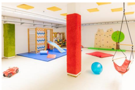
Bild 5: Turnhalle unserer Denk mit Kita Germering, Frühlingstraße

Der Eingangsbereich ist für uns wichtig, denn die Kinder sollen nicht abgegeben werden, sondern Eltern und Kinder sollen sich Zeit nehmen können für die, gerade bei noch sehr kleinen Kindern, schwierig Phase des Loslassens. Je weniger Eile und Stress in dieser Situation auftreten durch zu wenig Platz und Gedränge, desto wohler können sich die Familien ab dem ersten Tag fühlen.