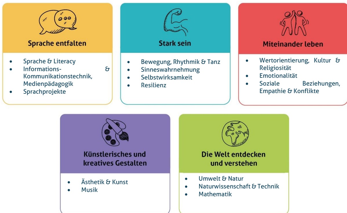
Abbildung 1: Die fünf Erfahrungsbereiche von Denk mit Kita für eine ganzheitliche Bildung