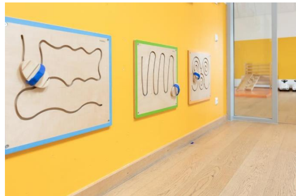
Bild 9 & 10: Kinderbad und Spielzeug in der Denk mit Kita Gauting Stockdorf, Webastolinis

Der großzügige Garderoben- und Eingangsbereich bietet den Eltern, Kindern und Geschwisterkindern in der Einrichtung einen Raum, um sie willkommen zu heißen.