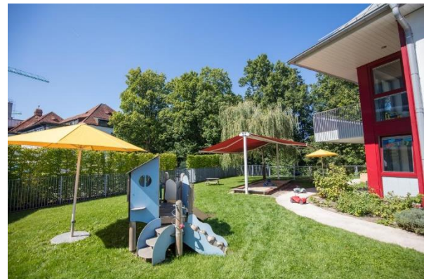
Bild 11 & 12: Mehrzweckraum und Garten in der Denk mit Kita Gauting Stockdorf, Webastolinis

Aufbau von Bewegungsparcours genutzt werden. Die Kinder haben genügend Freiraum zum Toben und Spielen. Hierfür werden den Kindern die unterschiedlichsten Materialien zur Verfügung gestellt. Natürlich gehören hierzu klassische Balancierelemente, Springseile, Jongliermaterialien, Bälle und eine Hochebene mit Spiegel und Rutsche.