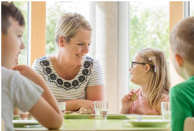
Bild: Pädagogin mit Kind

Nun kann die Zeit, in der das Kind allein in der Gruppe ist, langsam gesteigert werden. Ziel ist es, dass sich das Kind mit seinem eigenen Tempo auf die neue Umgebung, das pädagogische Fachpersonal und die anderen Kinder einstellen kann.