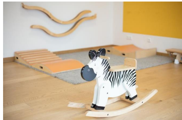
Bild 4 & 5: Raumgestaltung unserer Denk mit Kita Gauting Stockdorf, Webastolinis

Wir bieten entwicklungsgerechte Einrichtungsgegenstände und Spielmaterialien an und geben genügend Freiraum zum Krabbeln, Laufen, Hüpfen, zum Ziehen oder Schieben größerer Wagen und Ähnlichem. So sind die Laufwege frei und ohne Hindernisse. Klare Raumstrukturen unterstützen die Orientierung des Kindes im Raum. Wir haben unsere Gruppenräume so gegliedert, dass bestimmte Spiele in den dafür vorgesehenen Bereichen ermöglicht werden und die Spielutensilien dort erreichbar sind. Die vielen Anregungen für Körper und Sinne finden sich nicht nur in den für die Umsetzung der pädagogischen Konzeption typischen Spielsachen wieder, sondern vielmehr in Materialien, die sowohl die kindliche Wahrnehmung als auch die kognitiven Fähigkeiten stärken.