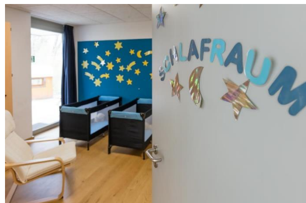
Bild 7 & 8: Gruppenraum und Schlafraum in der Denk mit Kita Gauting Stockdorf, Webastolinis

Neben Alltags- und Naturmaterialien, wie beispielsweise runde und eckige Holzklötze, Siebe, Dosen, Tücher, Baumscheiben, Metallschalen, Kartons und mehr für freies Experimentieren bieten die Räume sinnvolle Erfahrungszugänge, die sie zu eigenaktivem Handeln anregen.