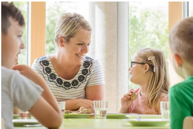
Bild: Pädagogin mit Kind

Nun kann die Zeit, in der das Kind allein in der Gruppe ist, langsam gesteigert werden. Ziel ist es, dass sich das Kind mit seinem eigenen Tempo auf die neue Umgebung, das pädagogische Fachpersonal und die anderen Kinder einstellen kann.