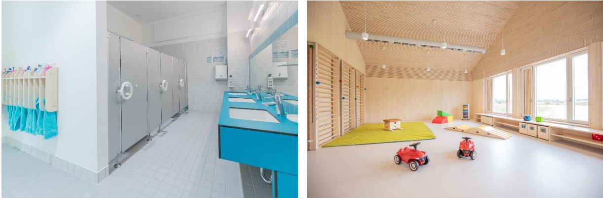
Bild 7 & 8: Beispielbilder Kinderbad und Mehrzweckraum in der Denk mit Kita Anzing

In dem Gruppenraum des Kindergartens laden eine Spielempore, eine Puppenecke und auch eine Kuschecke bestehend aus einem Sofa mit vielen Kissen und Decken, sowie verschiedene Möglichkeiten von Brettspielen, Puzzeln, Büchern und vielem mehr, die Kinder zum Spielen ein.