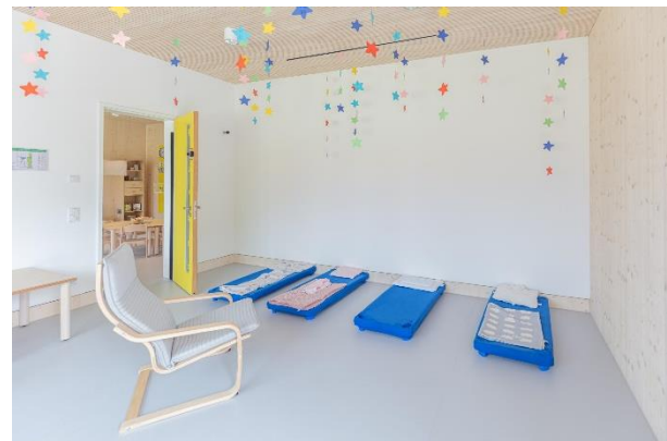
Bild 7 & 8: Beispielbilder Kinderbad und Schlafraum in der Denk mit Kita Anzing

Der Krippenteppich „Circelino“ dient im Kinderkrippengruppenraum als täglicher Treffpunkt für den Morgenkreis. Auf seinen zwölf Punkten findet jedes Kind einen Platz und gemeinsam kann im Morgenkreis der Tag mit Fingerspielen, Liedern und dem gemeinsamen Zählen der Kinder begonnen werden. Unsere Gruppenräume sind so möbliert, dass die Kinder hier auch ihre Mahlzeiten einnehmen können. Hier ist es uns wichtig, den Kindern einen ruhigen ritualisierten Rahmen zu bieten, gemeinsam am Tisch zu sitzen und das Essen zu genießen. Unsere Gruppenräume sind so möbliert, dass die Kinder hier auch ihre Mahlzeiten einnehmen können. Hier ist es uns wichtig, den Kindern einen ruhigen ritualisierten Rahmen zu bieten, gemeinsam am Tisch zu sitzen und das Essen zu genießen.