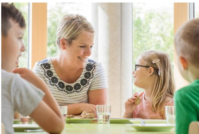
Bild: Pädagogin mit Kind

Nun kann die Zeit, in der das Kind allein in der Gruppe ist, langsam gesteigert werden. Ziel ist es, dass sich das Kind mit seinem eigenen Tempo auf die neue Umgebung, das pädagogische Fachpersonal und die anderen Kinder einstellen kann.