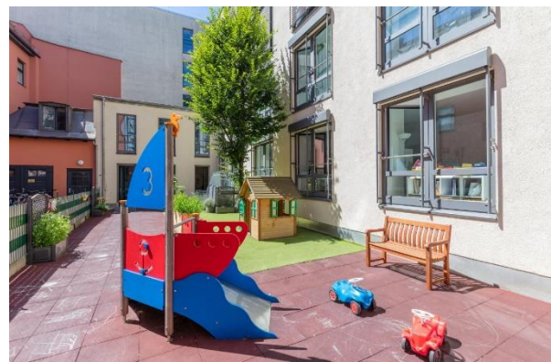
Bild 9 & 10: Mehrzweckraum und Garten der Denk mit Kita München Schwanthalerhöhe