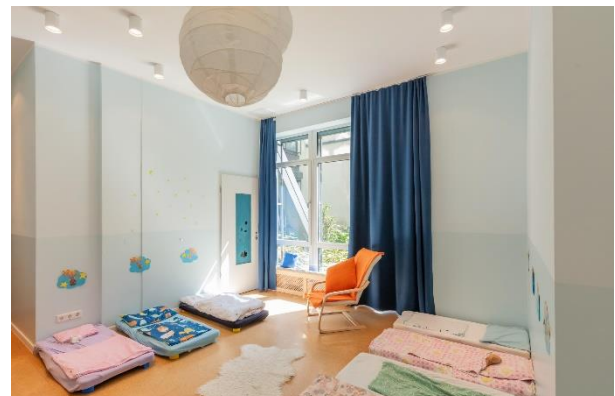
Bild 7 & 8: Gruppen- und Schlafräum in der Denk mit Kita München Schwanthalerhöhe