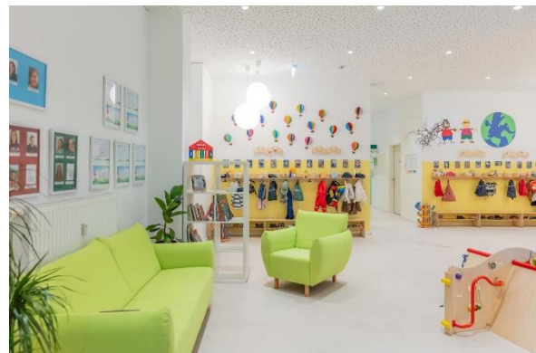
Bild 4 & 5: Raumgestaltung unserer Denk mit Kita München Schwanthalerhöhe

Die räumliche Ausstattung und Ausgestaltung orientieren sich an den Bedürfnissen der uns anvertrauten Säuglinge, Kleinkinder und Kinder. Gemeinsames Spielen ist ebenso möglich wie vorübergehender Rückzug. Das Bedürfnis nach aktiver körperlicher Bewegung kann ebenso erfüllt werden, wie der Wunsch des Kindes nach Kontaktaufnahme zum pädagogischen Fachpersonal und einem gemeinsamen Spiel und Dialog. Damit sich die Kinder gut orientieren, in der Eingewöhnungszeit Vertrauen aufbauen und Vertrautes wiedererkennen können, ist die gute Strukturierung der Gruppenräume Grundlage.