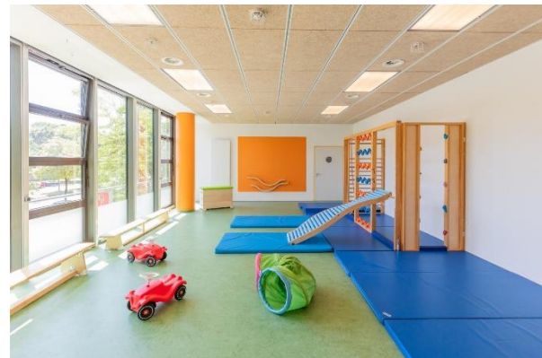
Bild 9 & 10: Garten und Mehrzweckraum der Denk mit Kita München Schwabing

Außerdem werden Teamtafeln mit Fotos der ErzieherInnen aufgehängt, sodass sich alle Eltern schnell und einfach ein Bild von den Fachkräften machen können und damit auch ihre/n AnsprechpartnerIn schnell erkennen können. Die Teamtafel bietet auch eine gute Gelegenheit Vertrauen in das Personal zu legen, auch z. B. wenn Springer im Haus sind.