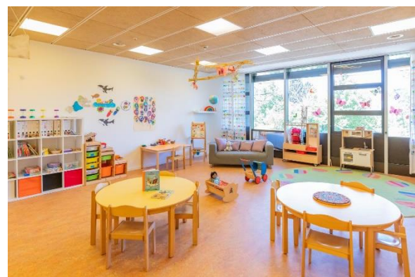
Bild 4 & 5: Raumgestaltung unserer Denk mit Kita München Schwabing

Die räumliche Ausstattung und Ausgestaltung orientierten sich an den Bedürfnissen der uns anvertrauten Säuglinge, Kleinkinder und Kinder. Gemeinsames Spielen ist ebenso möglich wie vorübergehender Rückzug. Das Bedürfnis nach aktiver körperlicher Bewegung kann ebenso erfüllt werden, wie der Wunsch des Kindes nach Kontaktaufnahme zum pädagogischen Fachpersonal und einem gemeinsamen Spiel und Dialog. Damit sich die Kinder gut orientieren, in der Eingewöhnungszeit Vertrauen aufbauen und Vertrautes wiedererkennen können, ist die gute Strukturierung der Gruppenräume Grundlage.