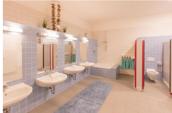
Bild 9 & 10: Mehrzweckraum und Bad der Denk mit Kita München Obersendling

bietet umfangreiche Bewegungsanregungen. Die Kinder können ihr Klettertalent am großzügigen Klettergerüst mit Rutsche erproben, den „Schleichweg“, die Krabbelröhre und die Holzstämme erkunden, unterschiedliche Pflanzen beim Wachsen beobachten & die Nestschaukel nutzen. Beim Experimentieren im Wasserspiel-, Sand- und Matschspielbereich, können sich die Kinder selbst spüren, ihre Kreativität ausleben und ihren Körper bewusst wahrnehmen, wie zum Beispiel auch beim Erklimmen der Findlinge & Hügel außer Atem geraten. Sie erleben, wie es sich anfühlt auf unterschiedlichen Untergründen wie Sand, Matsch, Teer oder Gras zu laufen. Zusätzlich können sie sich mit Spielmaterialien, wie Schwungtuch, Hüpftiere oder verschiedene Bälle und Tücher beschäftigen, welche die Fachkräfte nach Bedarf zur Verfügung stellen.