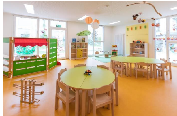
Bild 7 & 8: Gruppenraum in der Denk mit Kita München Obersendling

Der Multifunktionsraum verbindet die Gruppenräume der Krippen- und Kindergartengruppen, welche sich zusätzlich einen gemeinsamen Flur und Hygienebereich teilen. Dieser ist von beiden Gruppen, Kindergarten und Kinderkrippe, zugänglich und kann für die teiloffene pädagogische Arbeit oder zum Spielen und Schlafen genutzt werden.