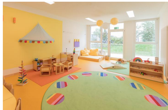
Bild 4 & 5: Raumgestaltung unserer Denk mit Kita München Obersendling

Die räumliche Ausstattung und Ausgestaltung orientierten sich an den Bedürfnissen der uns anvertrauten Säuglinge, Kleinkinder und Kinder. Gemeinsames Spielen ist ebenso möglich wie vorübergehender Rückzug. Das Bedürfnis nach aktiver körperlicher Bewegung kann ebenso erfüllt werden, wie der Wunsch des Kindes nach Kontaktaufnahme zum pädagogischen Fachpersonal und einem gemeinsamen Spiel und Dialog. Damit sich die Kinder gut orientieren, in der Eingewöhnungszeit Vertrauen aufbauen und Vertrautes wiedererkennen können, ist die gute Strukturierung der Gruppenräume Grundlage.