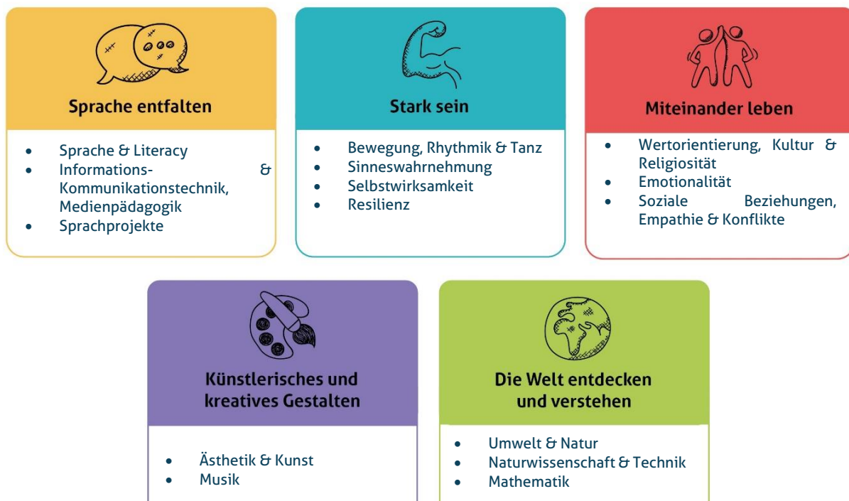
Abbildung 1: Die fünf Erfahrungsbereiche von Denk mit Kita für eine ganzheitliche Bildung

Diese werden individuell auf alle Altersgruppen der von uns zu betreuenden Kinder angepasst und unter einem extra Gliederungspunkt näher beschrieben. Unsere Kita gestaltet durch vielfältige Angebote ein geeignetes Lernumfeld, damit unsere Kinder Basiskompetenzen erwerben und weiterentwickeln können.