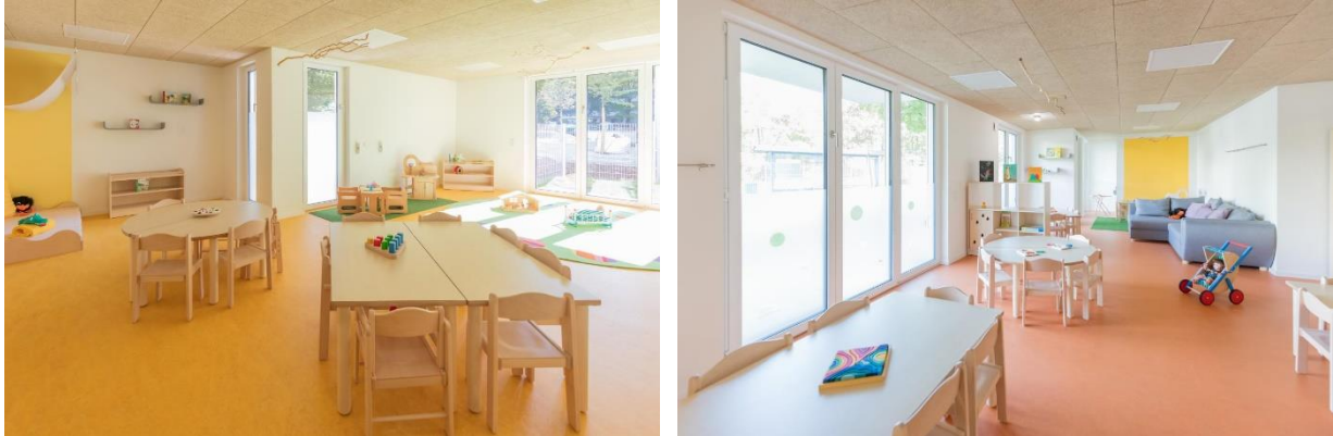
Bild 7 & 8: Gruppenraum in der Denk mit Kita München Neuperlach Zentrum

Decken, sowie verschiedene Möglichkeiten von Brettspielen, Puzzeln, Büchern und vielem mehr, die Kinder zum Spielen ein.