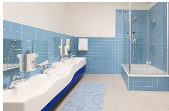
Bild 4 & 5: Raumgestaltung unserer Denk mit Kita München Neuperlach Zentrum

Die räumliche Ausstattung und Ausgestaltung orientierten sich an den Bedürfnissen der uns anvertrauten Säuglinge, Kleinkinder und Kinder. Gemeinsames Spielen ist ebenso möglich wie vorübergehender Rückzug. Das Bedürfnis nach aktiver körperlicher Bewegung kann