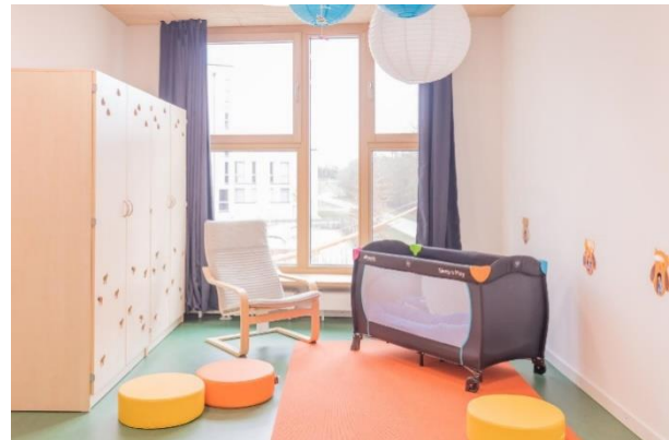
Bild 9 & 10: Kinderbad und Schlafraum in der Denk mit Kita München Neuperlach Süd

Genauso genutzt wird der große Eingangsbereich (Aula) im Erdgeschoss, der eine zusätzliche Funktion unterhalb der Treppe zum Rückzug bietet. Hier können unsere Krippenkinder ihre Ruhephasen mit Lesen und Musikhören verbringen. Im Vergleich dazu lädt der erste Stock durch zwei kleine Nischen mit einem Kaufladen und einem Puppenhaus die Kinder zum Rollenspiel ein. Im vorderen Bereich des Treppenhauses befindet sich eine Lesecke, die somit einen zusätzlichen Raum für kleine Kindergruppen bietet. Aus hygienischen Gründen werden deshalb in diesen Bereichen keine Straßenschuhe getragen.