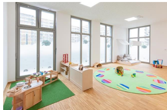
Bild 4 & 5: Beispielbilder Raumgestaltung unserer Denk mit Kita München Freiam

Die räumliche Ausstattung und Ausgestaltung orientierten sich an den Bedürfnissen der uns anvertrauten Säuglinge, Kleinkinder und Kinder. Gemeinsames Spielen ist ebenso möglich wie vorübergehender Rückzug. Das Bedürfnis nach aktiver körperlicher Bewegung kann ebenso erfüllt werden, wie der Wunsch des Kindes nach Kontaktaufnahme zum pädagogischen Fachpersonal und einem gemeinsamen Spiel und Dialog. Damit sich die Kinder gut orientieren, in der Eingewöhnungszeit Vertrauen aufbauen und Vertrautes wiedererkennen können, ist die gute Strukturierung der Gruppenräume Grundlage.