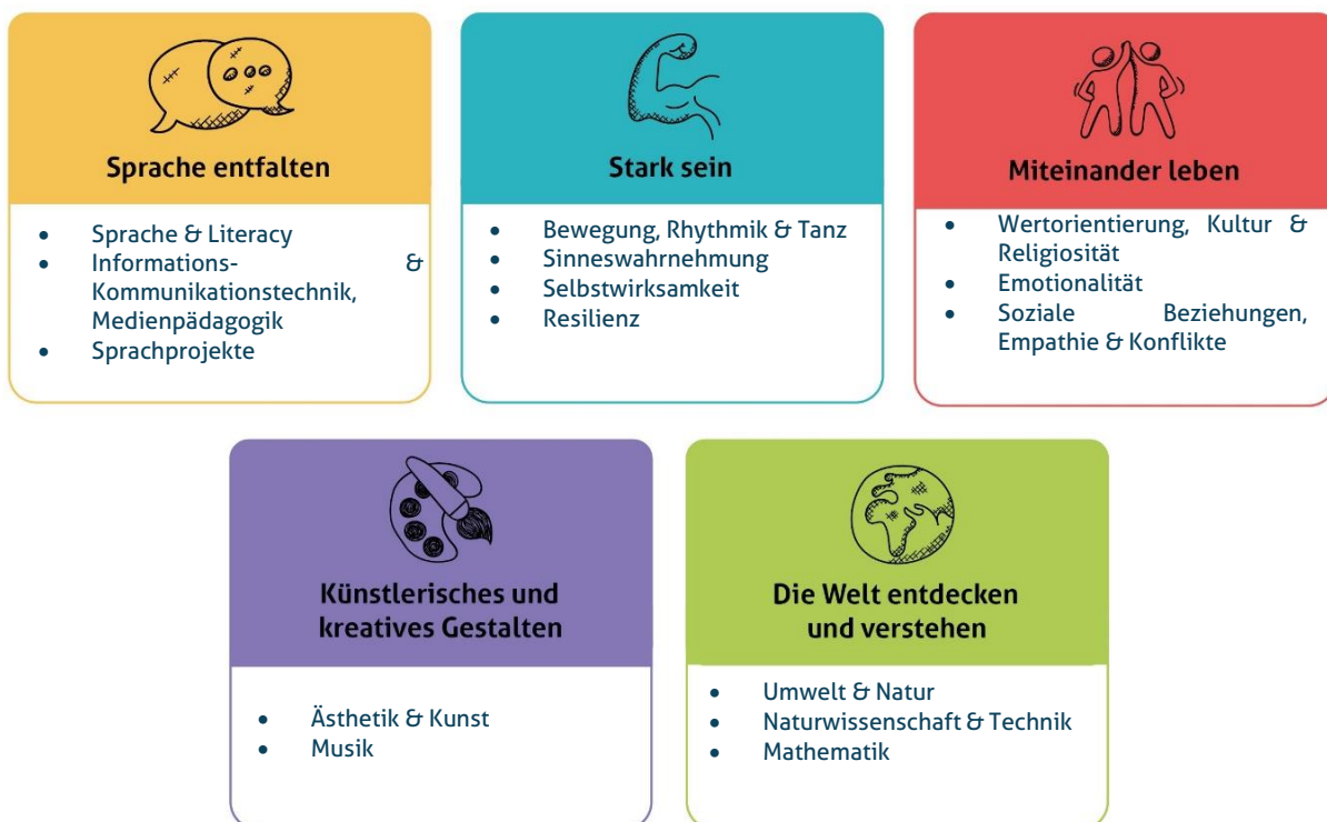
Abbildung 1: Die fünf Erfahrungsbereiche von Denk mit Kita für eine ganzheitliche Bildung

Diese werden individuell auf alle Altersgruppen der von uns zu betreuenden Kinder angepasst und unter einem extra Gliederungspunkt näher beschrieben. Unsere Kita gestaltet durch vielfältige Angebote ein geeignetes Lernumfeld, damit unsere Kinder Basiskompetenzen erwerben und weiterentwickeln können.