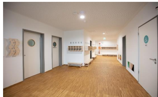
Bild 9 & 10: Beispielbilder Eingang & Flur der Denk mit Kita München Freiham

kleinen Schützlinge und deren Eltern in Empfang nehmen und gegebenenfalls auch eine kurze Rücksprache mit den Eltern halten.