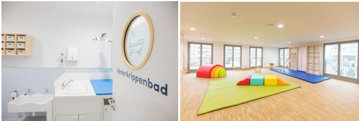
Bild 7 & 8: Beispielbilder Kinderbad und Turnhalle in der Denk mit Kita München Freiam

seinen eigenen Ruheplatz mit einer Liege und eigenem Bettzeug bzw. einem Schlafsack und dem mitgebrachten Stofftier. Während der Ruhephase können die Krippenkinder nach einem erlebnisreichen Vormittag neue Energie für den Nachmittag sammeln. Dieser Schlafplatz wird entsprechend gekennzeichnet. Jedes Kind findet selbst sein Bett und erfährt Sicherheit, da sich dieses gemeinsam mit dem eigenen Kuscheltier oder Schnuller immer am selben Platz befindet.