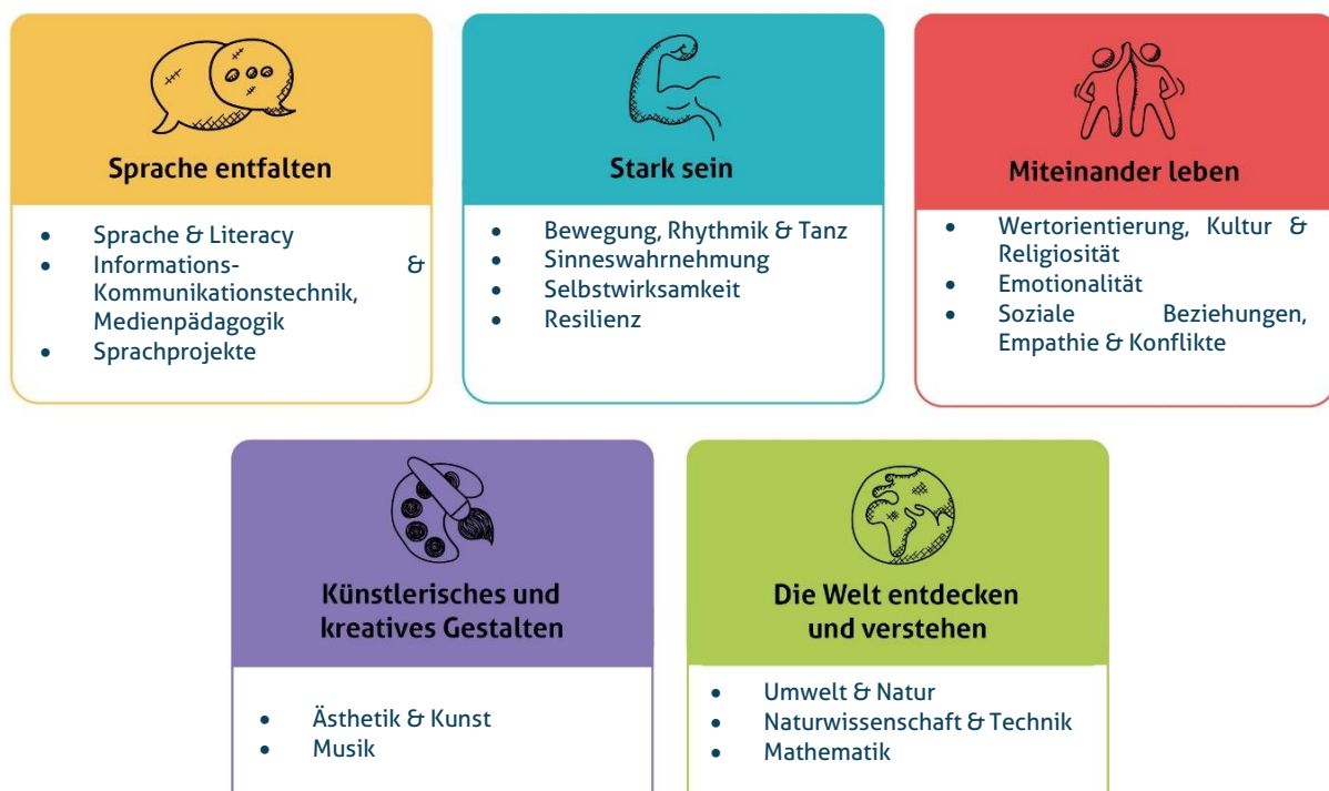
Abbildung 1: Die fünf Erfahrungsbereiche von Denk mit Kita für eine ganzheitliche Bildung

Wir sehen die Basiskompetenzen als Grundlage für weiteres Lernen. Sie dienen der Persönlichkeitsentwicklung und sind der Grundstein für die Interaktion und Auseinandersetzung mit anderen Individuen und unserer Umwelt. Die Basiskompetenzen werden im Kleinkindalter vorwiegend über Bewegung im freien Spiel und im Alltag entwickelt sowie durch eigene Erfahrungen und Erlebnisse gefestigt. Die Umsetzung der genannten Bildungs- und Erziehungsziele erfolgt durch unsere fünf Erfahrungsbereiche. So ist es uns möglich in unserer pädagogischen Arbeit alle Erfahrungsbereiche in der Woche aufzugreifen und ganzheitliche Bildung zu garantieren. Zudem können wir diese für die Familien in unseren Wochenplänen sichtbar dokumentieren. Die Bereiche dienen den Mitarbeiter:innen zur Orientierung und als Leitfaden für die Planung und Umsetzung vielfältiger Projekte. Nach dem Prinzip der ganzheitlichen Bildung stellen unsere fünf