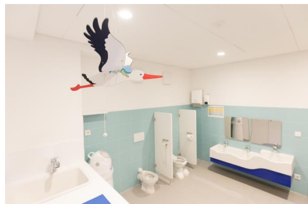
Bild 7 & 8: Gruppenraum und Kinderbad der Denk mit Kita München Bogenhausen, Jensenstraße

Krippenkinder, die zur Mittagszeit nicht mehr schlafen, bekommen, so wie die Kindergartenkinder, eine Yoga-Matte auf der sie sich ausruhen können. Nach etwa 30 Minuten Ruhen dürfen die Kinder wieder aufstehen und ins leise Spiel finden, um die schlafenden Kinder nicht zu wecken.