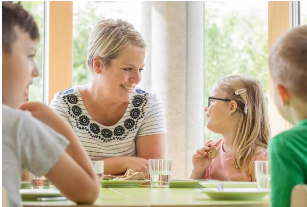
Bild: Pädagogin mit Kind

Wir führen in der Trennungsphase feste Rituale für das Kind ein. Das kann das tägliche Winken am Fenster sein, das Mitbringen eines vertrauten Spielzeugs, eines Kuscheltiers oder das Singen eines Liedes. Oft helfen auch unterstützende Dinge wie der Schnuller oder das Lieblingstuch, um den Übergang von Vertrautem zu Neuem zu erleichtern. Die Verabschiedung fällt dem Kind leichter, wenn sie kurz, aber trotzdem liebevoll ist. Auch vielen Familien fällt der Abschied schwer. Das persönliche Übernehmen des