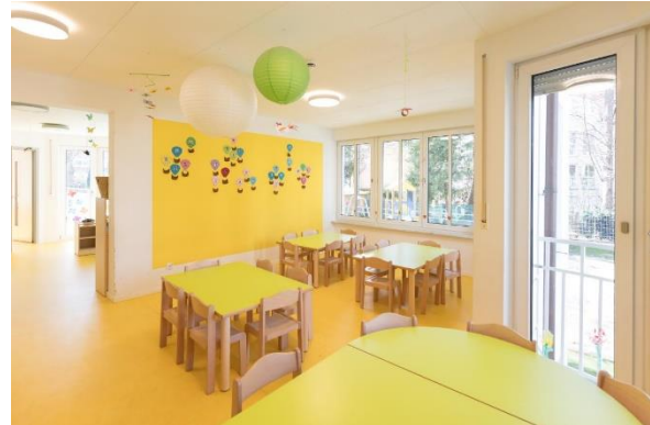
Bild 4 & 5: Raumgestaltung unserer Denk mit Kita München Bogenhausen, Jensenstraße

Wir bieten entwicklungsgerechte Einrichtungsgegenstände und Spielmaterialien an und geben genügend Freiraum zum Krabbeln, Laufen, Hüpfen, zum Ziehen oder Schieben größerer Wagen und Ähnlichem. So sind die Laufwege frei und ohne Hindernisse. Klare Raumstrukturen unterstützen die Orientierung des Kindes im Raum. Wir haben unsere Gruppenräume so gegliedert, dass bestimmte Spiele in den dafür vorgesehenen Bereichen ermöglicht werden und die Spielutensilien dort erreichbar sind. Die vielen Anregungen für Körper und Sinne finden sich nicht nur in den für die Umsetzung der pädagogischen Konzeption typischen Spielsachen wieder, sondern vielmehr in Materialien, die sowohl die kindliche Wahrnehmung als auch die kognitiven Fähigkeiten stärken.