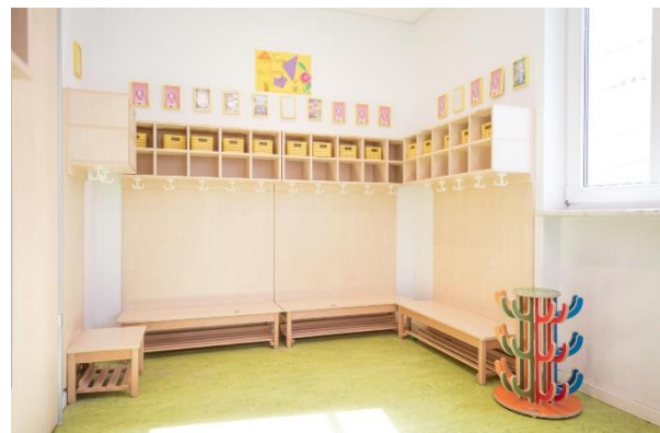
Bild 9 & 10: Mehrzweckraum und Garderobe der Denk mit Kita München Bogenhausen, Jensenstraße

Eine Besonderheit im Kindergarten stellt das mit den Kindern gemeinsam entwickelte Pinnsystem dar. Jeder Raum, bzw. Spielbereich, hat eine festgelegte Anzahl an Plätzen. Die Kinder kleben ihr Bild in dem Raum oder Bereich ein, in dem sie spielen möchten. Dadurch