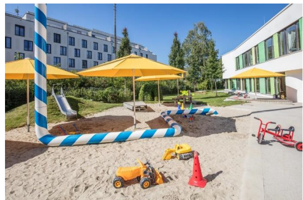
Bild 9 & 10: Boulderwand und Garten der Denk mit Kita München Berg am Laim

Der Garten bietet umfangreiche Bewegungsanregungen. Die Kinder können ihr Klettertalent an einem großzügigen Klettergerüst erproben, Wettrennen auf der Bobbycar Rennstrecke fahren, unterschiedliche Pflanzen beim Wachsen beobachten, experimentieren in der Wasserspiel-, Sand- und Matschfläche, spüren, wie sie durch das Erklimmen der Hügel außer