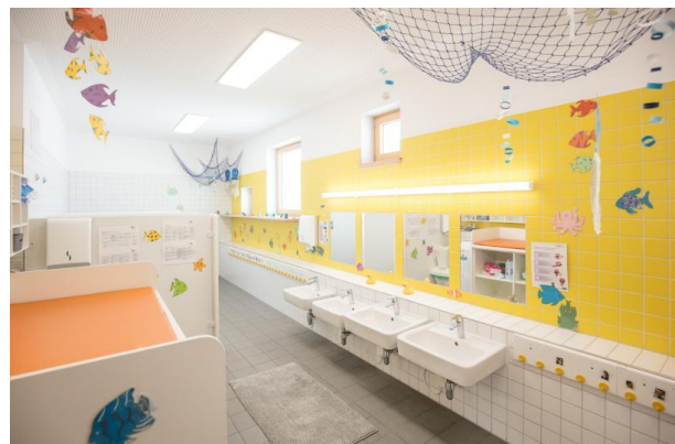
Bild 7 & 8: Gruppenraum und Kinderbad Denk mit Kita München Berg am Laim

Außerhalb der Schlafenszeit kann der Raum mit wenigen Handgriffen umgestaltet werden für beispielsweise gemeinsame Stuhlkreise, Rollenspiele, Erstellung von Bauwerken und pädagogische Angebote. Im Multifunktionsraum kann sowohl der Bewegungsdrang ausgelebt, mit anderen Kindern in Interaktion getreten, gemeinsam gearbeitet und gelernt als auch für die Möglichkeit des Rückzugs genutzt werden.