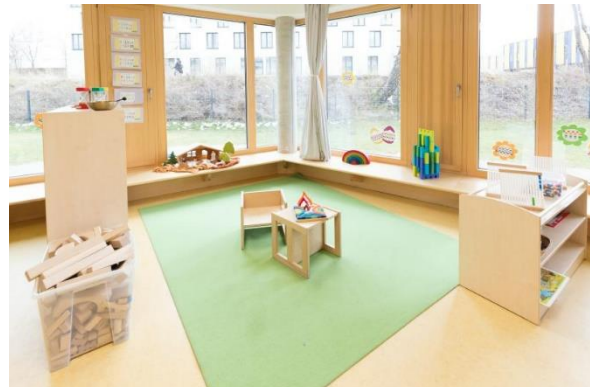
Bild 4 & 5: Raumgestaltung unserer Denk mit Kita München Berg am Laim

Die räumliche Ausstattung und Ausgestaltung orientierten sich an den Bedürfnissen der uns anvertrauten Säuglinge, Kleinkinder und Kinder. Gemeinsames Spielen ist ebenso möglich wie vorübergehender Rückzug. Das Bedürfnis nach aktiver körperlicher Bewegung kann ebenso erfüllt werden, wie der Wunsch des Kindes nach Kontaktaufnahme zum pädagogischen Fachpersonal und einem gemeinsamen Spiel und Dialog. Damit sich die Kinder gut orientieren, in der Eingewöhnungszeit Vertrauen aufbauen und Vertrautes wiedererkennen können, ist die gute Strukturierung der Gruppenräume Grundlage.