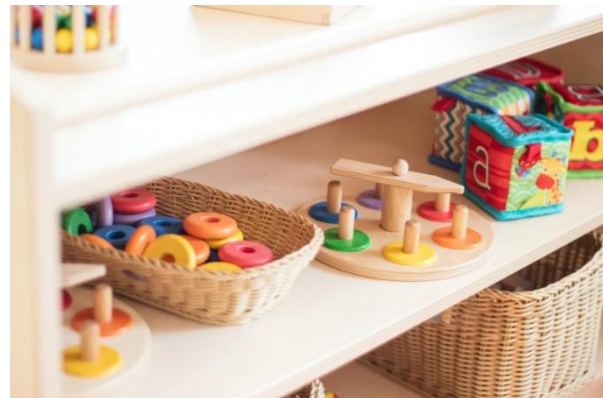
Bild 9 & 10: Spielmaterialien der Denk mit Kita München Berg am Laim

Unsere Schulkinder haben in ihrem großzügigen Gruppenraum die Möglichkeit, pädagogische Angebote wahrzunehmen und sich frei zu beschäftigen. Dieser dient zudem für das gemeinsame Mittagessen, welches gegen 13 Uhr stattfindet. Der Raum ist mit ausreichend Tischen und Stühlen für die Kinder ausgestattet und zusätzlich in verschiedene altersentsprechende Spiel- und Kreativbereiche gegliedert.