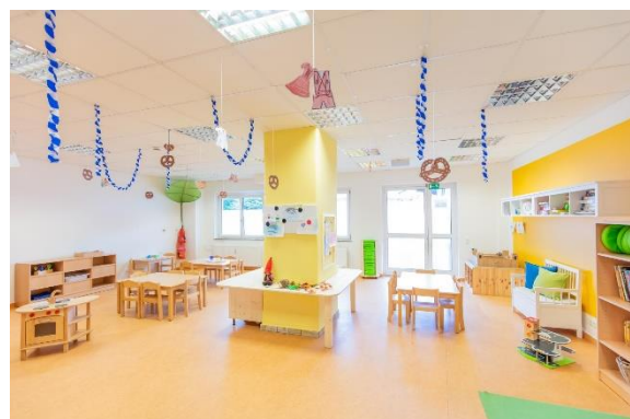
Bild 4 & 5: Beispielbilder Raumgestaltung unserer Denk mit Kita München Aubing Altostraße

Die räumliche Ausstattung und Ausgestaltung orientierten sich an den Bedürfnissen der uns anvertrauten Säuglinge, Kleinkinder und Kinder. Gemeinsames Spielen ist ebenso möglich wie vorübergehender Rückzug. Das Bedürfnis nach aktiver körperlicher Bewegung kann ebenso erfüllt werden, wie der Wunsch des Kindes nach Kontaktaufnahme zum pädagogischen Fachpersonal und einem gemeinsamen Spiel und Dialog. Damit sich die Kinder gut orientieren, in der Eingewöhnungszeit Vertrauen aufbauen und Vertrautes wiedererkennen können, ist die gute Strukturierung der Gruppenräume Grundlage.