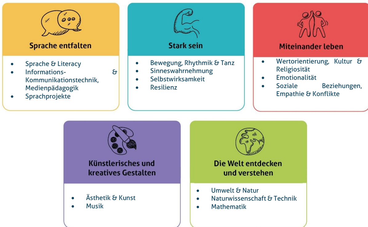
Abbildung 1: Die fünf Erfahrungsbereiche von Denk mit Kita für eine ganzheitliche Bildung

Diese werden individuell auf alle Altersgruppen der von uns zu betreuenden Kinder angepasst und unter einem extra Gliederungspunkt näher beschrieben. Unsere Kita gestaltet durch vielfältige Angebote ein geeignetes Lernumfeld, damit unsere Kinder Basiskompetenzen erwerben und weiterentwickeln können.