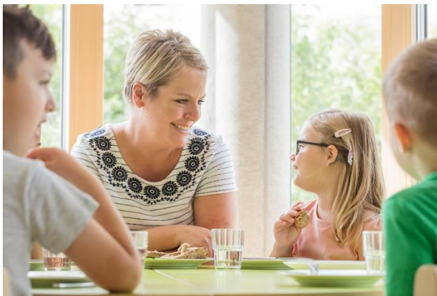
Bild: Pädagogin mit Kind

Schritt für Schritt wird die neue Umgebung mit länger werdender Abwesenheit der Familien und der Begleitung einer wichtigen, vertrauten Person vom Kind erobert. Gleichzeitig können auch die Familien Vertrauen in die verantwortlichen Personen der Kinderkrippe aufbauen.