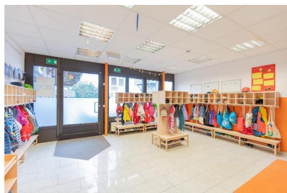
Bild 7 & 8: Beispielbilder Kinderbad und Kinderflur in der Denk mit Kita München Aubing Altostraße

Des Weiteren verfügt der Kindergarten über einen separat abgetrennten Bereich für die Puppenecke und die Spielküche, hier finden Rollenspiele statt und zudem dient dieser Raum als Rückzugsort.