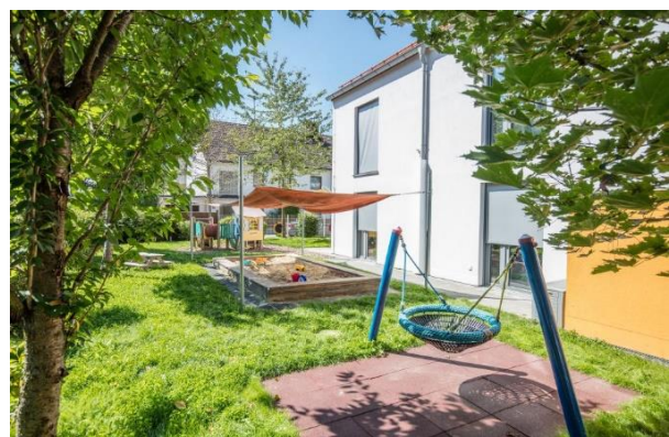
Bild 9 & 10: Mehrzweckraum und Garten der Denk mit Kita München Waldperlach

Außerdem werden Teamtafeln mit Fotos des pädagogischen Fachpersonals aufgehängt, so dass sich alle Eltern schnell und einfach ein Bild von den Fachkräften machen können und damit auch ihren Ansprechpartner schnell erkennen können. Die Teamtafel bietet auch eine gute Gelegenheit Vertrauen in das Personal zu legen, auch z. B. wenn Springer im Haus sind.