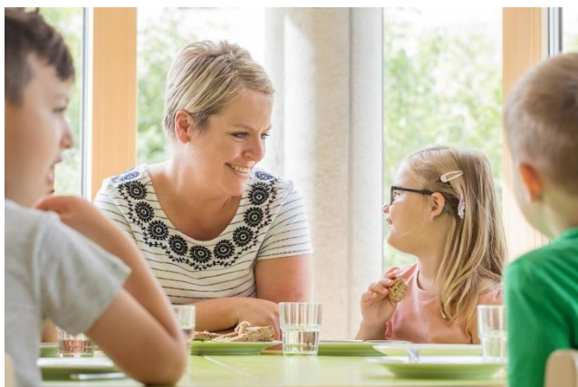
Bild: Pädagogin mit Kind

Wir führen in der Trennungsphase feste Rituale für das Kind ein. Das kann das tägliche Winken am Fenster sein, das Mitbringen eines vertrauten Spielzeugs, eines Kuscheltiers oder das Singen eines Liedes. Oft helfen auch unterstützende Dinge wie der Schnuller oder das Lieblingstuch, um den Übergang von Vertrautem zu Neuem zu erleichtern. Die Verabschiedung fällt dem Kind leichter, wenn sie kurz, aber trotzdem liebevoll ist. Auch vielen Familien fällt der Abschied schwer. Das persönliche Übernehmen des