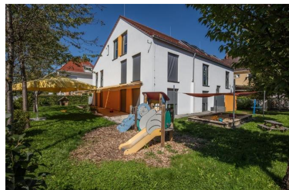
Bild 4 & 5: Raumgestaltung unserer Denk mit Kita München Waldperlach

Wir bieten entwicklungsgerechte Einrichtungsgegenstände und Spielmaterialien an und geben genügend Freiraum zum Krabbeln, Laufen, Hüpfen, zum Ziehen oder Schieben größerer Wagen und Ähnlichem. So sind die Laufwege frei und ohne Hindernisse. Klare Raumstrukturen unterstützen die Orientierung des Kindes im Raum. Wir haben unsere Gruppenräume so gegliedert, dass bestimmte Spiele in den dafür vorgesehenen Bereichen ermöglicht werden und die Spielutensilien dort erreichbar sind. Die vielen Anregungen für