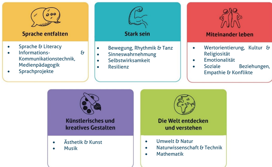
Abbildung 1: Die fünf Erfahrungsbereiche von Denk mit Kita für eine ganzheitliche Bildung