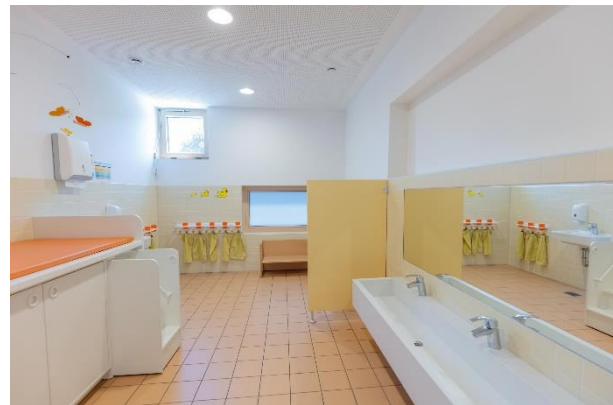
Bild 7 & 8: Gruppenraum und Kinderbad und Schlafraum in der Denk mit Kita München Ramersdorf-Perlach

Der Multifunktionsraum Raum verbindet die Gruppenräume der Krippen- und Kindergartengruppen, welche sich zusätzlich einen gemeinsamen Flur und Hygienebereich teilen. Dieser ist von beiden Gruppen, Kindergarten und Kinderkrippe, zugänglich und kann für die teiloffene pädagogische Arbeit oder zum Spielen und Schlafen genutzt werden. In unseren Multifunktionsräumen treffen sich größere und kleinere Kinder zum gemeinsamen Austausch und voneinander lernen. Die Räume bieten Platz für gemeinsame Spiel- und Erfahrungsbereiche der Kindergartenkinder und Krippenkinder wie z.B. eine Lesecke oder eine große Legobaustelle oder er wird für gezielte Angebote oder Projekte genutzt. Zu festgelegten Zeiten im Tagesablauf dient unser Multifunktionsraum als Schlaf- und Ruheraum für die jüngeren Kinder. Unsere Fachkräfte gestalten je nach funktioneller Nutzung den Raum für die entsprechenden Gelegenheiten um. So wird zur Schlafenszeit für jedes Kind der eigene Schlafplatz hergerichtet, von der eigenen Matratze, über den Schlafsack bis zum mitgebrachten Stofftier. Während der Spielphase finden die Matratzen