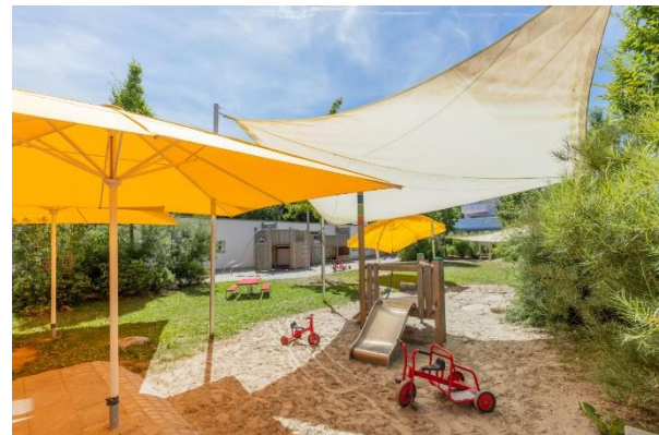
Bild 9 & 10: Mehrzweckraum und Garten der Denk mit Kita München Ramersdorf-Perlach

Von jedem Gruppenraum besteht ein direkter Zugang zu Außenspielfläche. Im Erdgeschoss zur Terrasse und in der zweiten Etage auf zwei sehr großzügige Balkone. Dies ermöglicht für die Kinder eine direkte Erweiterung des Spielraums und eine Öffnung in den Außenbereich.