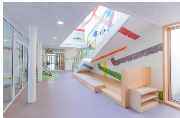
Bild 9 & 10: Gruppenraum und Flur der Denk mit Kita München Ramersdorf-Perlach

Die mit dem Kindergarten verbundenen Krippengruppen haben die Möglichkeit durch die gemeinsamen Begegnungen im Badezimmer die Kindergartenkinder bei der Körperhygiene als Vorbilder wahrzunehmen.