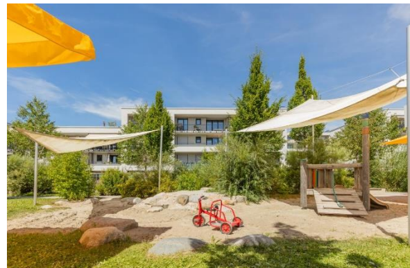
Bild 4 & 5: Raumgestaltung unserer Denk mit Kita München Ramersdorf-Perlach

Die räumliche Ausstattung und Ausgestaltung orientierten sich an den Bedürfnissen der uns anvertrauten Säuglinge, Kleinkinder und Kinder. Gemeinsames Spielen ist ebenso möglich wie vorübergehender Rückzug. Das Bedürfnis nach aktiver körperlicher Bewegung kann