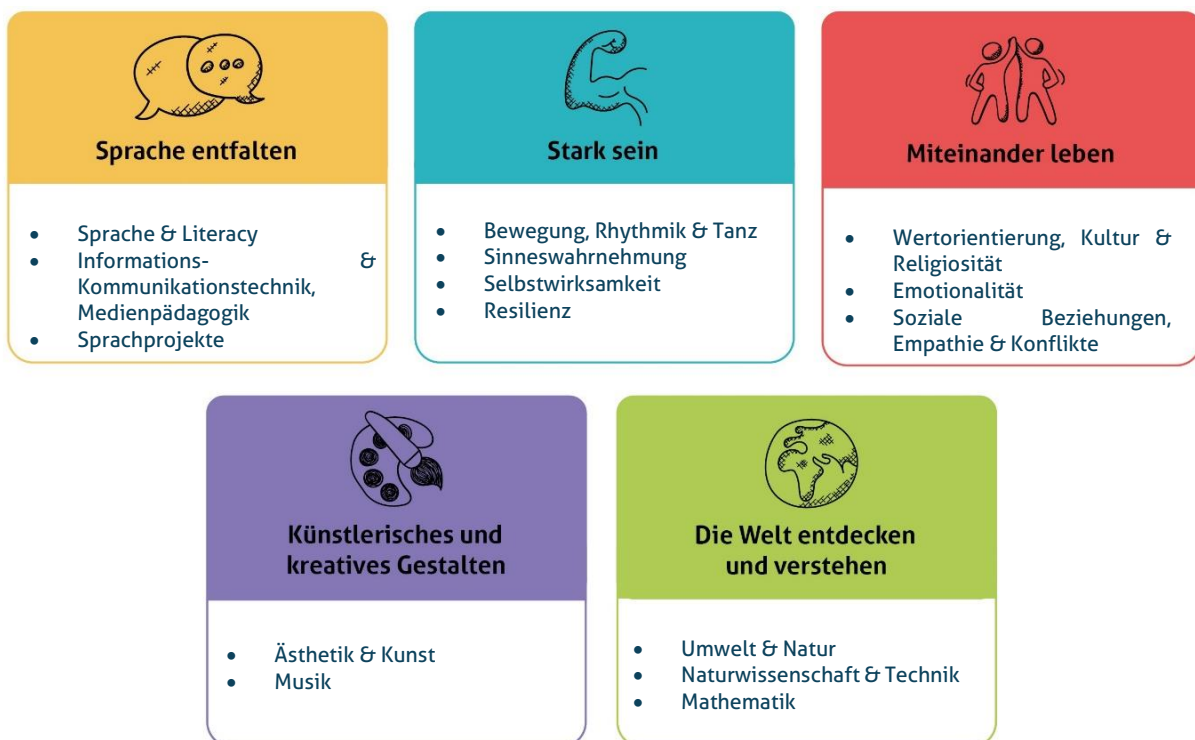
Abbildung 1: Die fünf Erfahrungsbereiche von Denk mit Kita für eine ganzheitliche Bildung

Wir sehen die Basiskompetenzen als Grundlage für weiteres Lernen. Sie dienen der Persönlichkeitsentwicklung und sind der Grundstein für die Interaktion und Auseinandersetzung mit anderen Individuen und unserer Umwelt. Die Basiskompetenzen werden im Kleinkindalter vorwiegend über Bewegung im freien Spiel und im Alltag entwickelt sowie durch eigene Erfahrungen und Erlebnisse gefestigt. Die Umsetzung der genannten Bildungs- und Erziehungsziele erfolgt durch unsere fünf Erfahrungsbereiche. So ist es uns möglich in unserer pädagogischen Arbeit alle Erfahrungsbereiche in der Woche aufzugreifen und ganzheitliche Bildung zu garantieren. Zudem können wir diese für die Familien in unseren Wochenplänen sichtbar dokumentieren. Die Bereiche dienen den Päd. Mitarbeiter: innen zur Orientierung und als Leitfaden für die Planung und Umsetzung vielfältiger Projekte. Nach dem Prinzip der ganzheitlichen Bildung stellen unsere fünf Erfahrungsbereiche ein vielfältiges Angebot dar, in dem unsere Kinder mit allen Sinnen und vollem Körpereinsatz die Welt erforschen dürfen.