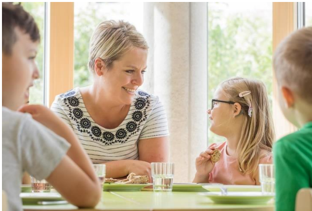
Bild: Pädagogin mit Kind

Wir führen in der Trennungsphase feste Rituale für das Kind ein. Das kann das tägliche Winken am Fenster sein, das Mitbringen eines vertrauten Spielzeugs, eines Kuscheltiers oder das Singen eines Liedes. Oft helfen auch unterstützende Dinge wie der Schnuller oder das Lieblingstuch, um den Übergang von Vertrautem zu Neuem zu erleichtern. Die Verabschiedung fällt dem Kind leichter, wenn sie kurz, aber trotzdem liebevoll ist. Auch vielen Familien fällt der Abschied schwer. Das persönliche Übernehmen des