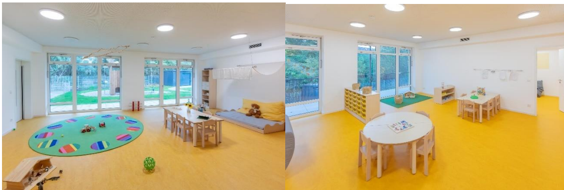
Bild: Beispielbilder Gruppenräume Krippe & Kindergarten

Hier laden eine Puppenecke, eine Bauecke, eine Kuschecke bestehend aus einem Sofa mit vielen Kissen und Decken, sowie verschiedene Möglichkeiten von Brettspielen, Puzzeln, Büchern und vielem mehr, die Kinder zum Spielen ein.