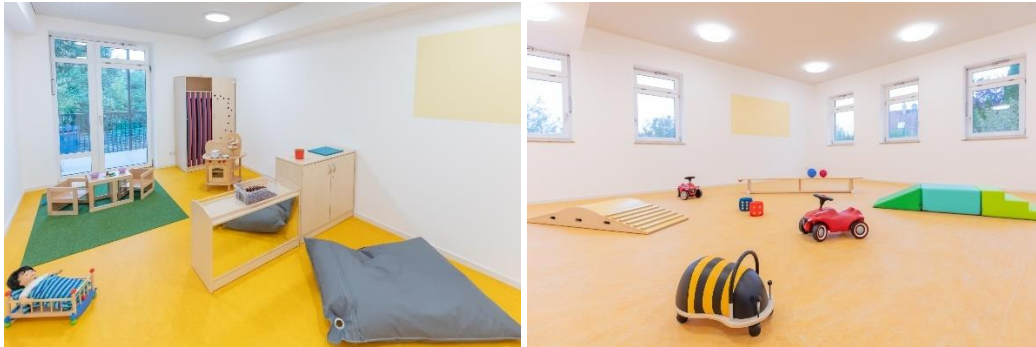
Bild: Beispielbilder Nebenraum & Mehrzweckraum

Die Mahlzeiten nehmen unseren Kindergarten im Kinderbistro im Obergeschoß ein.