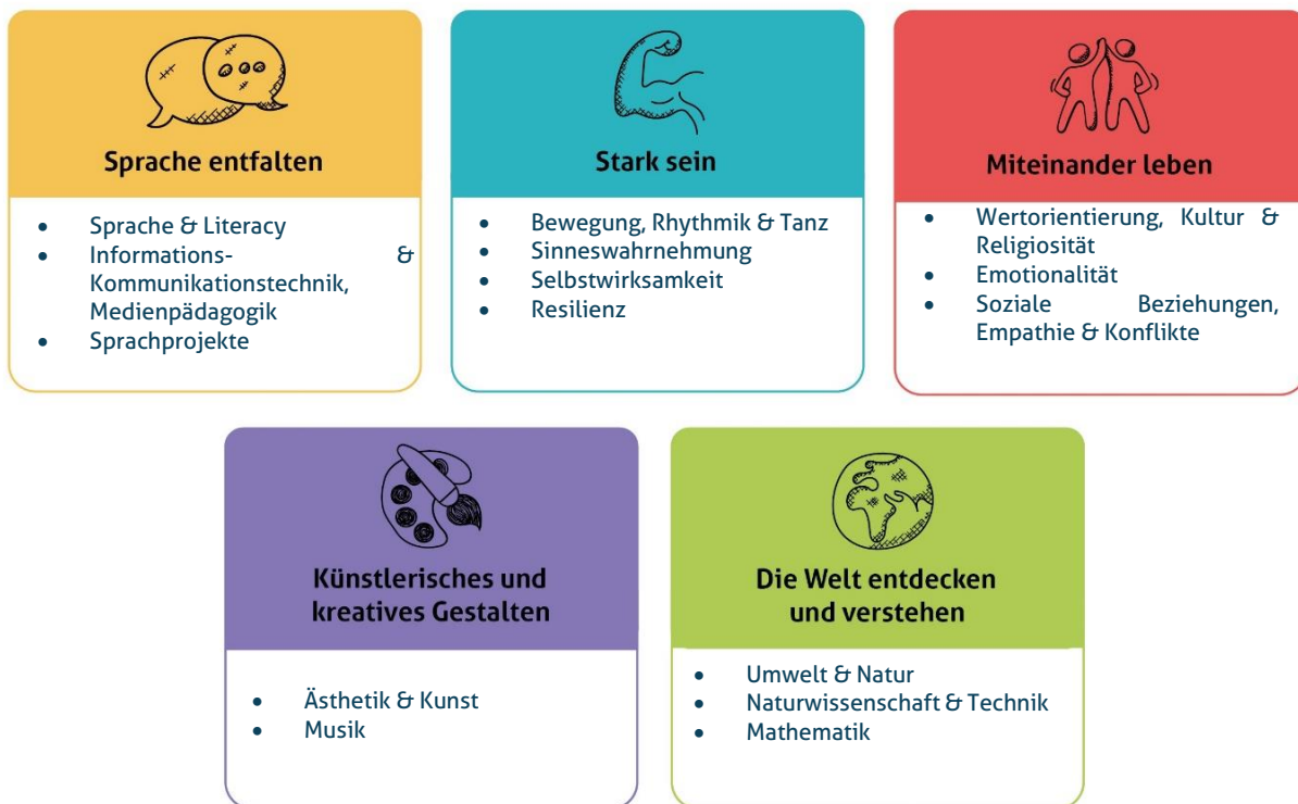
Abbildung 1: Die fünf Erfahrungsbereiche von Denk mit Kita für eine ganzheitliche Bildung

Diese werden individuell auf alle Altersgruppen der von uns zu betreuenden Kinder angepasst und unter einem extra Gliederungspunkt näher beschrieben. Unsere Kita gestaltet durch vielfältige Angebote ein geeignetes Lernumfeld, damit unsere Kinder Basiskompetenzen erwerben und weiterentwickeln können.