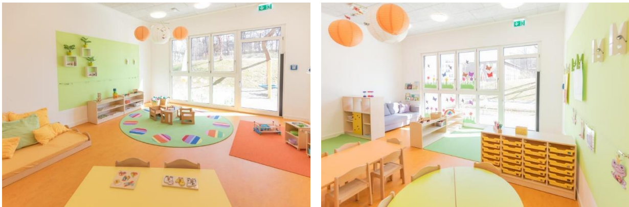
Bild 7 & 8: Gruppenräume in der Denk mit Kita München Sendling-Westpark

Zeit zum Nachdenken, philosophieren und entspannen bieten Nischen und Ecken. Die liebevoll mit Decken, Kissen und Teppichen ausgestatteten Rückzugsräume sollen als Ort der Ruhe fungieren. Damit die Lust am Lernen wieder erwachen kann, sind Ruhephasen von besonderer Bedeutung. Nur so können die gesammelten Erfahrungen und Eindrücke verarbeitet, reflektiert und mit bereits gewonnenen „inneren Mustern abgeglichen und verbunden werden“ (Zeiß 2011, Anregungsreiche Räume für die Jüngsten, S. 76-79). Dadurch wird die individuelle Vernetzung des Gehirns und die neuronalen Repräsentationen gestärkt.