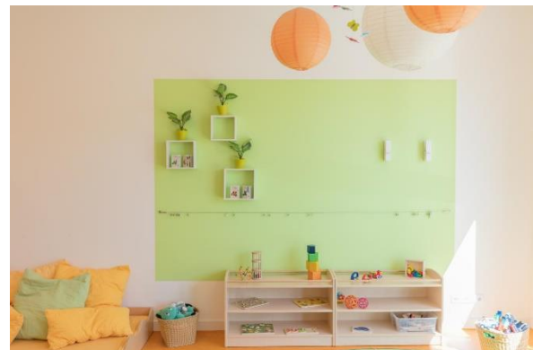
Bild 4 & 5: Raumgestaltung unserer Denk mit Kita München Sendling-Westpark

Die räumliche Ausstattung und Ausgestaltung orientieren sich an den Bedürfnissen der uns anvertrauten Säuglinge, Kleinkinder und Kinder. Gemeinsames Spielen ist ebenso möglich wie vorübergehender Rückzug. Das Bedürfnis nach aktiver körperlicher Bewegung kann ebenso erfüllt werden, wie der Wunsch des Kindes nach Kontaktaufnahme zum pädagogischen Fachpersonal und einem gemeinsamen Spiel und Dialog. Damit sich die Kinder gut orientieren, in der Eingewöhnungszeit Vertrauen aufbauen und Vertrautes wiedererkennen können, ist die gute Strukturierung der Gruppenräume Grundlage.