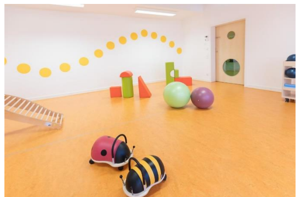
Bild 9 & 10: Kinderbad und Mehrzweckraum der Denk mit Kita München Sendling-Westpark

In der Einrichtung befindet sich auch eine Turnhalle mit einer Fläche von ca. 60m 2 . Die eingebaute Sprossenwand bietet den Kindern Klettermöglichkeiten. Der Raum kann jedoch auch zum Toben und Bewegen genutzt werden. Hierfür werden den Kindern die unterschiedlichsten Materialien zur Verfügung gestellt. Natürlich gehören hierzu klassische Balancierelemente, Springseile und Bälle.