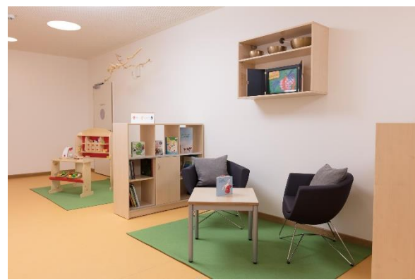
Bild 9 & 10: Schlafraum und Flurbereich der Denk mit Kita München Sendling

Hier werden die kindgerechten Garderoben der Kinder untergebracht und die Erzieher/-innen können im täglichen Betrieb ihre kleinen Schützlinge und deren Eltern in Empfang nehmen und gegebenenfalls auch eine kurze Rücksprache mit den Eltern halten. Zusätzlich werden in diesem Bereich Infotafeln angebracht, an welchen die Eltern aktuelle Informationen unserer Einrichtung einsehen können.