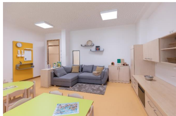
Bild 4 & 5: Raumgestaltung unserer Denk mit Kita München Sendling

Die räumliche Ausstattung und Ausgestaltung orientierten sich an den Bedürfnissen der uns anvertrauten Säuglinge, Kleinkinder und Kinder. Gemeinsames Spielen ist ebenso möglich wie vorübergehender Rückzug. Das Bedürfnis nach aktiver körperlicher Bewegung kann ebenso erfüllt werden, wie der Wunsch des Kindes nach Kontaktaufnahme zum