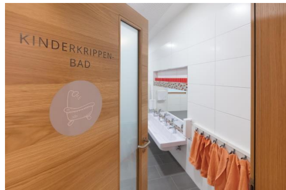
Bild 7 & 8: Turnhalle & Badezimmer in der Denk mit Kita München Sendling