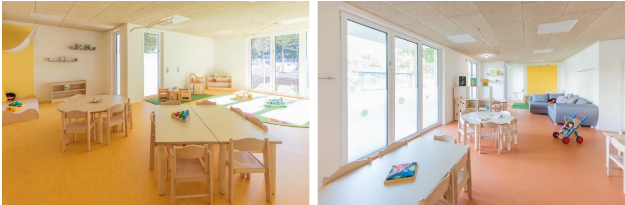
Bild 7 & 8: Gruppenraum in der Denk mit Kita München Neuperlach Zentrum

Decken, sowie verschiedene Möglichkeiten von Brettspielen, Puzzeln, Büchern und vielem mehr, die Kinder zum Spielen ein.