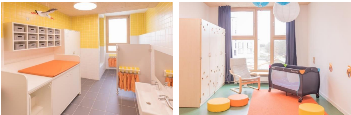
Bild 9 & 10: Kinderbad und Schlafraum in der Denk mit Kita München Neuperlach Süd

Der Flur vor den Gruppenräumen kann ebenfalls als Raum zum Spielen, Bewegen, Krabbeln und für Begegnung und Interaktionen zwischen den Kinderkrippengruppen genutzt werden.