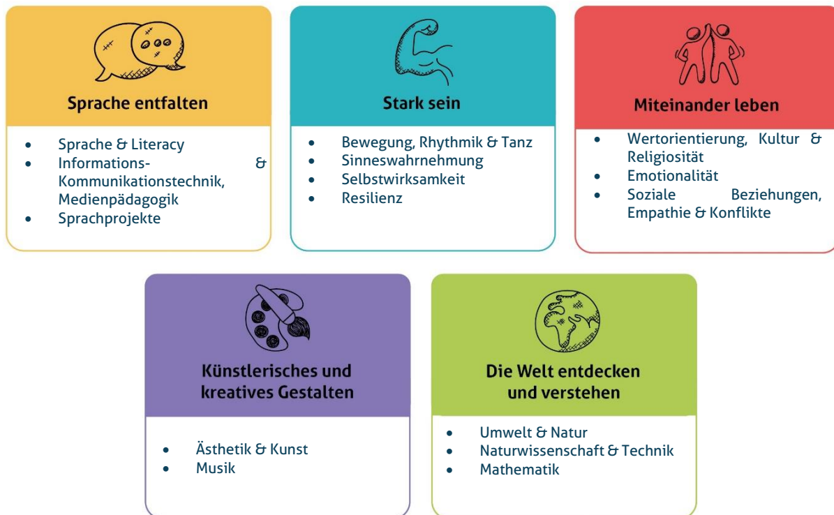
Abbildung 1: Die fünf Erfahrungsbereiche von Denk mit Kita für eine ganzheitliche Bildung

Diese werden individuell auf alle Altersgruppen der von uns zu betreuenden Kinder angepasst und unter einem extra Gliederungspunkt näher beschrieben. Unsere Kita gestaltet durch vielfältige Angebote ein geeignetes Lernumfeld, damit unsere Kinder Basiskompetenzen erwerben und weiterentwickeln können.