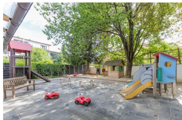
Bild 4 & 5: Raumgestaltung unserer Denk mit Kita München Großhadern

Die räumliche Ausstattung und Ausgestaltung orientierten sich an den Bedürfnissen der uns anvertrauten Säuglinge, Kleinkinder und Kinder. Gemeinsames Spielen ist ebenso möglich wie vorübergehender Rückzug. Das Bedürfnis nach aktiver körperlicher Bewegung kann ebenso erfüllt werden, wie der Wunsch des Kindes nach Kontaktaufnahme zum pädagogischen Fachpersonal und einem gemeinsamen Spiel und Dialog. Damit sich die Kinder gut orientieren, in der Eingewöhnungszeit Vertrauen aufbauen und Vertrautes wiedererkennen können, ist die gute Strukturierung der Gruppenräume Grundlage.