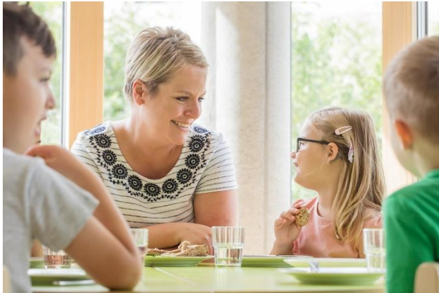
Bild: Pädagogin mit Kind

Nun kann die Zeit, in der das Kind allein in der Gruppe ist, langsam gesteigert werden. Ziel ist es, dass sich das Kind mit seinem eigenen Tempo auf die neue Umgebung, das pädagogische Fachpersonal und die anderen Kinder einstellen kann.