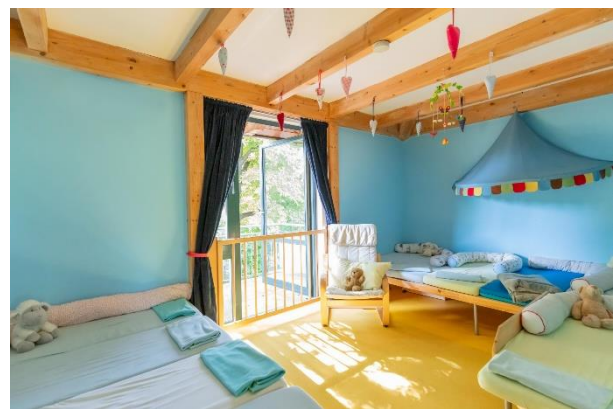
Bild 7 & 8: Gruppenraum und Schlafraum in der Denk mit Kita München Großhadern

In unserem Entdecker:innen Club Gruppenraum haben die Kinder die Möglichkeit, in den unterschiedlichen Spielbereichen (Baubereich, Rollenspielbereich,...) zu spielen, und ihren Bedürfnissen nachzugehen. So können sich die Kinder in unserem Kuschebereich zurückziehen, und auch mal in Ruhe ein Buch anschauen oder ein Buch vorgelesen bekommen. Im Rollenspielbereich können die Kinder ihrer Phantasie freien Lauf lassen und das Erlebte durch spielerisches Nachahmen verarbeiten. Dazu stehen den Kindern eine Spielküche, Puppen mit Kinderwagen und Puppenbettchen, sowie eine Kindersitzecke zur Verfügung. In unserem Baubereich liegen den Kindern verschiedene Bausteine, Duplosteine, eine Holzisenbahn, ein Stapelturm und viele verschiedene Autos bereit. Außerdem können die Kinder sich aus unserem Spieleschrank verschiedene Feinmotorische Spiele wie Steckperlen, Fädelperlen, Puzzle oder auch Gemeinschaftsspiele herausnehmen und sich damit beschäftigen. Den Kindern steht ein Maltisch zur Verfügung, an dem sie kreativ tätig sein können.