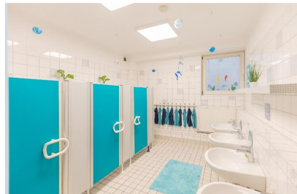
Bild 9 & 10: Gruppenraum und Kinderbad der Denk mit Kita München Großhadern