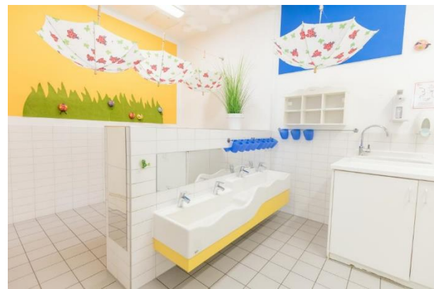
Bild 7 & 8: Gruppenraum und Kinderbad in der Denk mit Kita München Giesing

Die Möglichkeit zu schlafen oder Ruhe zu erleben ist ein fundamentales Grundbedürfnis für die gesunde Entwicklung des Kindes. Das ermöglicht die Verarbeitung der vielen Eindrücke und Informationen, die ein Kind im Kita-Alltag aufnimmt.