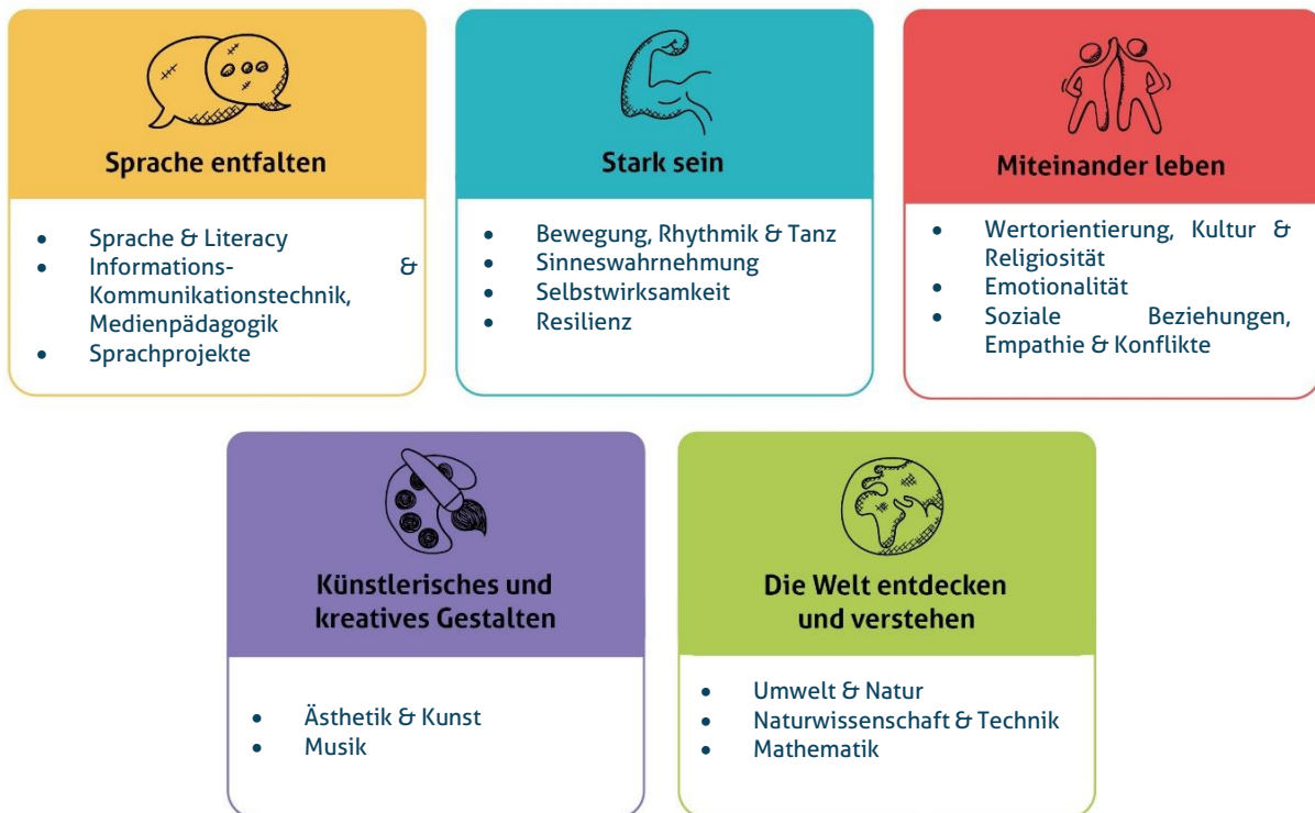
Abbildung 1: Die fünf Erfahrungsbereiche von Denk mit Kita für eine ganzheitliche Bildung

Wir sehen die Basiskompetenzen als Grundlage für weiteres Lernen. Sie dienen der Persönlichkeitsentwicklung und sind der Grundstein für die Interaktion und Auseinandersetzung mit anderen Individuen und unserer Umwelt. Die Basiskompetenzen werden im Kleinkindalter vorwiegend über Bewegung im freien Spiel und im Alltag entwickelt sowie durch eigene Erfahrungen und Erlebnisse gefestigt. Die Umsetzung der genannten Bildungs- und Erziehungsziele erfolgt durch unsere fünf Erfahrungsbereiche. So ist es uns möglich in unserer pädagogischen Arbeit alle Erfahrungsbereiche in der Woche aufzugreifen und ganzheitliche Bildung zu garantieren. Zudem können wir diese für die Familien in unseren Wochenplänen sichtbar dokumentieren. Die Bereiche dienen den Mitarbeiter:innen zur Orientierung und als Leitfaden für die Planung und Umsetzung