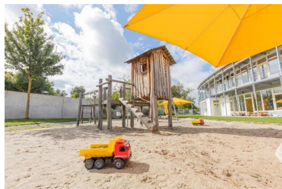
Bild 9 & 10: Beispielbilder Garten der Denk mit Kita München Aubing Ilse-Fehling-Straße

Der Garten bietet umfangreiche Bewegungsanregungen. Die Kinder können ihr Klettertalent am Klettergerüst erproben, Wettrennen mit den Bobbycars fahren, unterschiedliche Pflanzen beim Wachsen in Kinderbeeten, die selbst bepflanzt werden, betrachten. Beim Experimentieren im Wasser-, Sand- und Matschspielbereich, können sich die Kinder selbst spüren, ihre Kreativität ausleben und ihren Körper bewusst wahrnehmen. Sie erleben, wie es sich anfühlt auf unterschiedlichen Untergründen wie Sand, Matsch oder Gras zu laufen. Zusätzlich können sie sich mit Spielmaterialien, wie Schwungtuch oder verschiedene Bälle und Tücher beschäftigen, welche die Fachkräfte nach Bedarf zur Verfügung stellen.