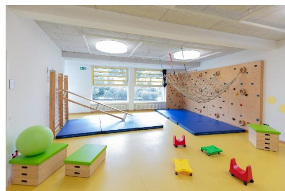
Bild 7 & 8: Beispielbilder Kinderbad und Turnhalle in der Denk mit Kita München Aubing Ilse-Fehling-Straße

Unsere Krippengruppen besitzen neben ihrem großzügigen Gruppenraum einen direkten Zugang zu einem Nebenraum/Multifunktionsraum, welcher je nach Gruppe auf unterschiedliche Weise ausgestattet ist und genutzt werden kann.