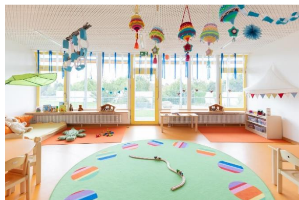
Bild 4 & 5: Raumgestaltung unserer Denk mit Kita München Aubing Ilse-Fehling-Straße

Die räumliche Ausstattung und Ausgestaltung orientierten sich an den Bedürfnissen der uns anvertrauten Säuglinge, Kleinkinder und Kinder. Gemeinsames Spielen ist ebenso möglich wie vorübergehender Rückzug. Das Bedürfnis nach aktiver körperlicher Bewegung kann ebenso erfüllt werden, wie der Wunsch des Kindes nach Kontaktaufnahme zum pädagogischen Fachpersonal und einem gemeinsamen Spiel und Dialog. Damit sich die Kinder gut orientieren, in der Eingewöhnungszeit Vertrauen aufbauen und Vertrautes wiedererkennen können, ist die gute Strukturierung der Gruppenräume Grundlage.