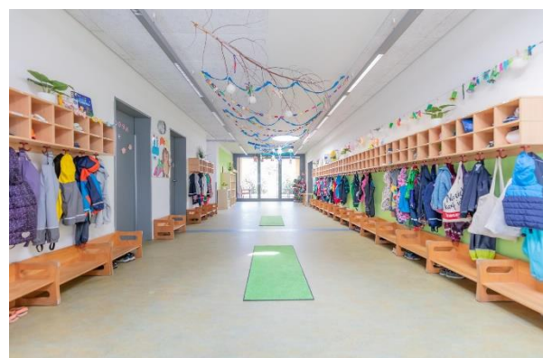
Bild 10 & 11: Garten und Garderobe der Denk mit Kita Bergkirchen, GADA