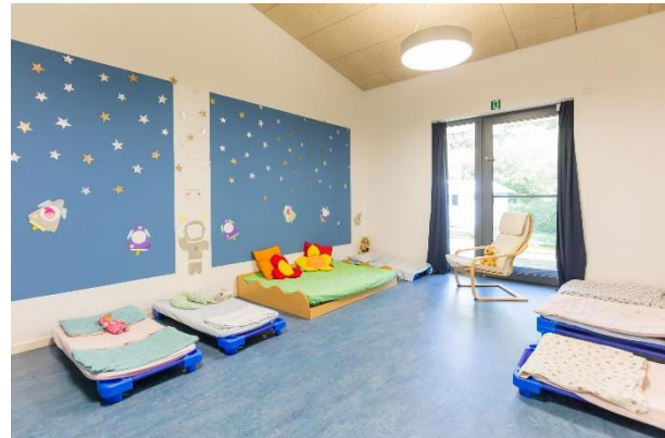
Bild 7 & 8: Gruppenraum und Schlafrum in der Denk mit Kita Bergkirchen, GADA

Die Krippengruppen besitzen jeweils einen Gruppenraum mit angeschlossenem Schlafrum. Der Krippenteppich „Circelino“ dient im Gruppenraum als täglicher Treffpunkt für den Morgenkreis. Auf seinen zwölf Punkten findet jedes Kind einen Platz und gemeinsam kann im Morgenkreis der Tag mit Fingerspielen, Liedern und dem gemeinsamen Zählen der Kinder begonnen werden.