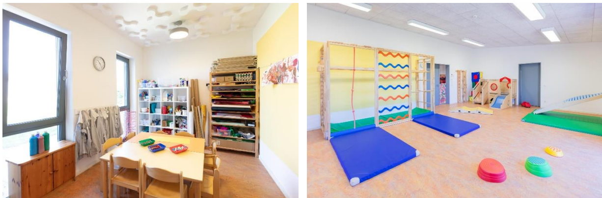
Bild 9 & 10: Kreativraum und Bewegungsraum in der Denk mit Kita Bergkirchen, GADA

Der großzügige Bewegungsraum bietet ausreichend Möglichkeiten, um neue, motorische Erfahrungen zu sammeln und vorhandene Fähigkeiten zu üben. Ausgestattet ist dieser mit einer großen Klappturnwand, einem Bällebad und einer Mini-Spielebene mit Rutsche. Einzelne Bewegungselemente werden zum Aufbau von Bewegungsparcours benutzt, diese stärken die motorische Entwicklung und trainieren die Koordination und das Gleichgewicht. Für vielfältige Bewegungserfahrungen werden den Kindern die unterschiedlichsten Materialien zur Verfügung gestellt, wie z.B. klassische Balancierelemente, Springseile, Jongliermaterialien und Bälle.