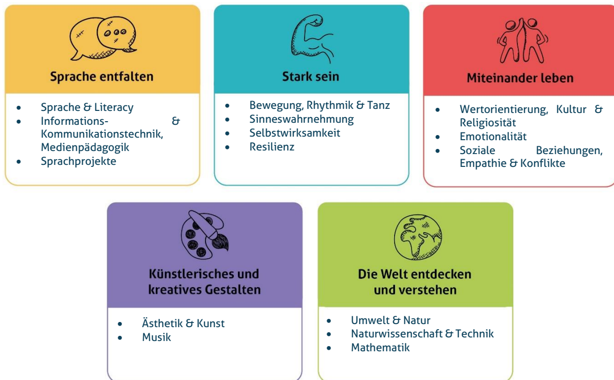
Abbildung 1: Die fünf Erfahrungsbereiche von Denk mit Kita für eine ganzheitliche Bildung

Diese werden individuell auf alle Altersgruppen der von uns zu betreuenden Kinder angepasst und unter einem extra Gliederungspunkt näher beschrieben. Unsere Kita gestaltet durch vielfältige Angebote ein geeignetes Lernumfeld, damit unsere Kinder Basiskompetenzen erwerben und weiterentwickeln können.