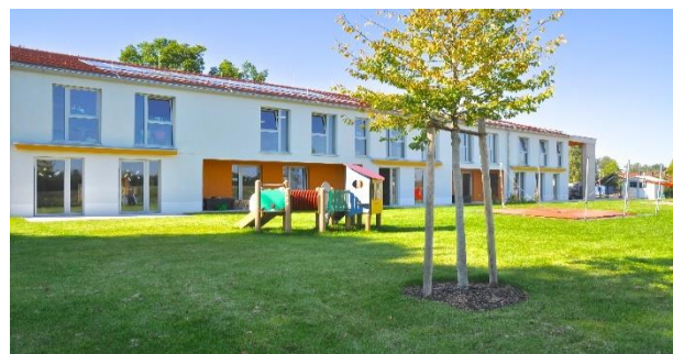
Bild : Garten der Denk mit Kita Baierbrunn