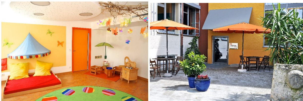
Bild 7 & 8: Gruppenraum und Eingangsbereich in der Denk mit Kita Augsburg

Für die bedürfnisorientierte Gestaltung des Tagesablaufs stehen den Kindern eine Vielzahl an Räumen auf insgesamt drei Ebenen zur Verfügung. Unsere Räumlichkeiten orientieren sich prinzipiell an den Grundbedürfnissen der Kinder. Die Abwechslung zwischen Bewegung und Ruhen, aber auch zwischen Kreativität und angeleiteten Aktivitäten sind ein wichtiger Baustein unserer pädagogischen Arbeit. Die hellen, lichtdurchfluteten Zimmer mit vielen Fenstern sorgen für eine angenehme Atmosphäre und wirken durch das permanente Tageslicht offen und freundlich.