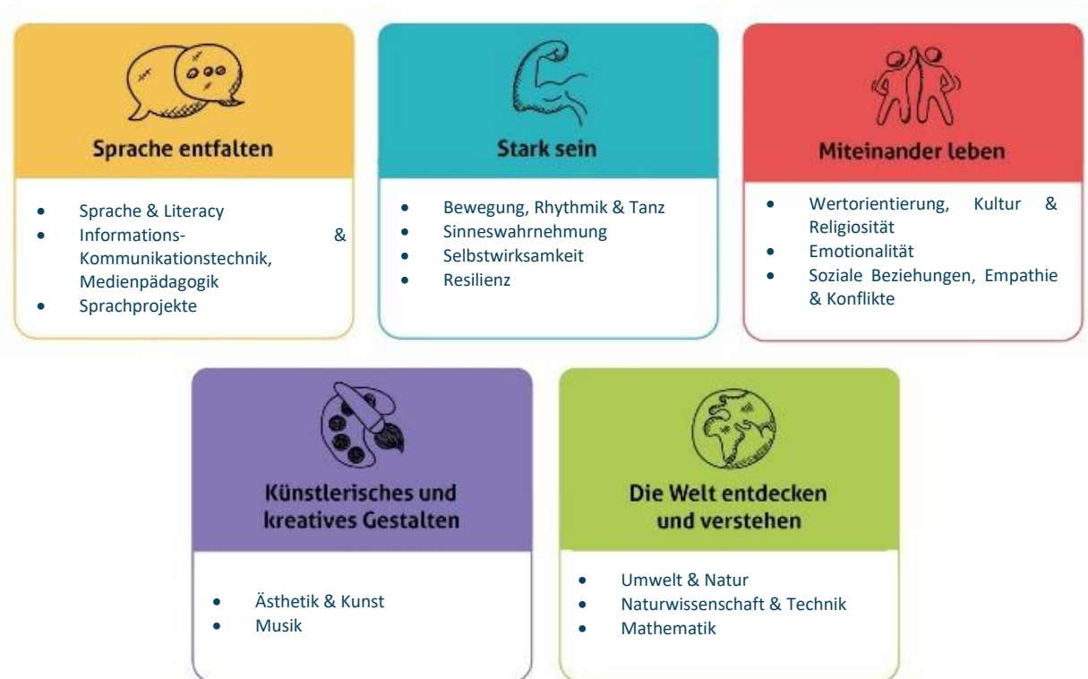
Abbildung 2: Die fünf Erfahrungsbereiche von Denk mit Kita für eine ganzheitliche Bildung