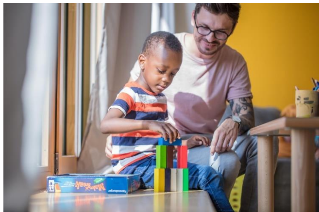
Bild: Pädagoge mit Kind in einer Denk mit Kita

Unsere Pädagogen sind Vorbilder bei Konflikt- und Grenzsetzungssituationen im sozialen Geschehen, an denen sich die Kinder im Spiel orientieren können. Jedes Kind signalisiert auf seine Weise, wie viel und welche Art der Unterstützung es benötigt. Jede Entwicklungsphase stellt einen wichtigen Zwischenschritt auf dem Weg zur selbstständigen Bewältigung neuer Anforderungen dar. Die Pädagogen beobachten aufmerksam die kindlichen Verhaltensäußerungen in Mimik und Gestik. Erst wenn es diesen gelingt, die