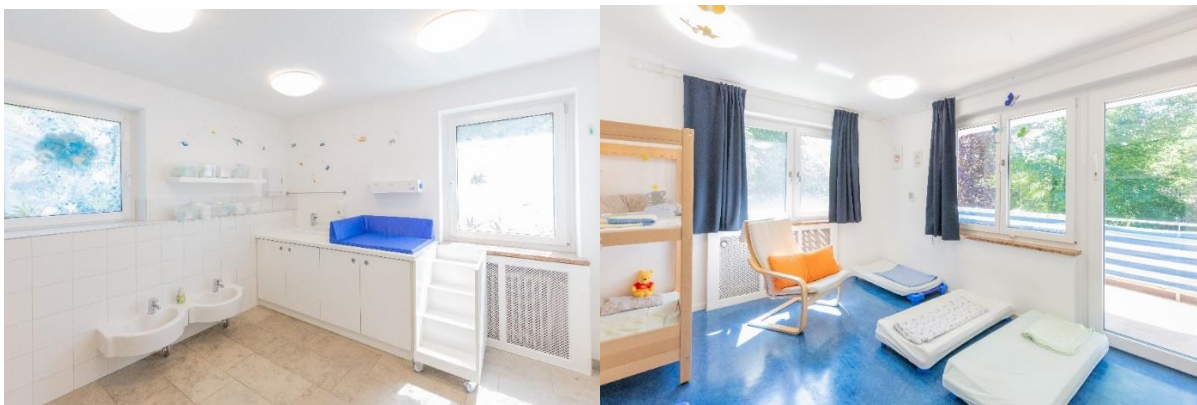
Bild 3 & 4: Kinderbad und Schlafraum unserer Denk mit Kita Tuttlingen

Jede Kindergruppe besitzt einen eigenen Gruppenraum mit Nebenraum, der als Spiel- oder Schlafraum dient. Der „Circelino“-Teppich dient als gemeinsamer Treffpunkt, wo jedes Kind im Morgenkreis seinen eigenen Platz findet. Unsere Kinderbäder sind an die Bedürfnisse der Kinder angepasst. Durch Waschbecken auf Kinderhöhe, Babytoiletten sowie eine Wickelkommode mit integrierter Treppe wird hier die Selbständigkeit der Kinder unterstützt. Die Pflegezeit in der Krippe stellt die intensivste Zeit der Zuwendung dar. In dieser Zeit haben das Kind und die pädagogische Fachkraft die Möglichkeit, ihre Beziehung zueinander zu vertiefen und eine verlässliche Bindung aufzubauen. Eine gelungene Bindung ist wiederum Voraussetzung für die Bildungsprozesse eines Kindes. Die beziehungsvolle Pflege ist ein Element der Arbeit nach Emmi Pikler und geht einher mit der professionellen Responsivität.