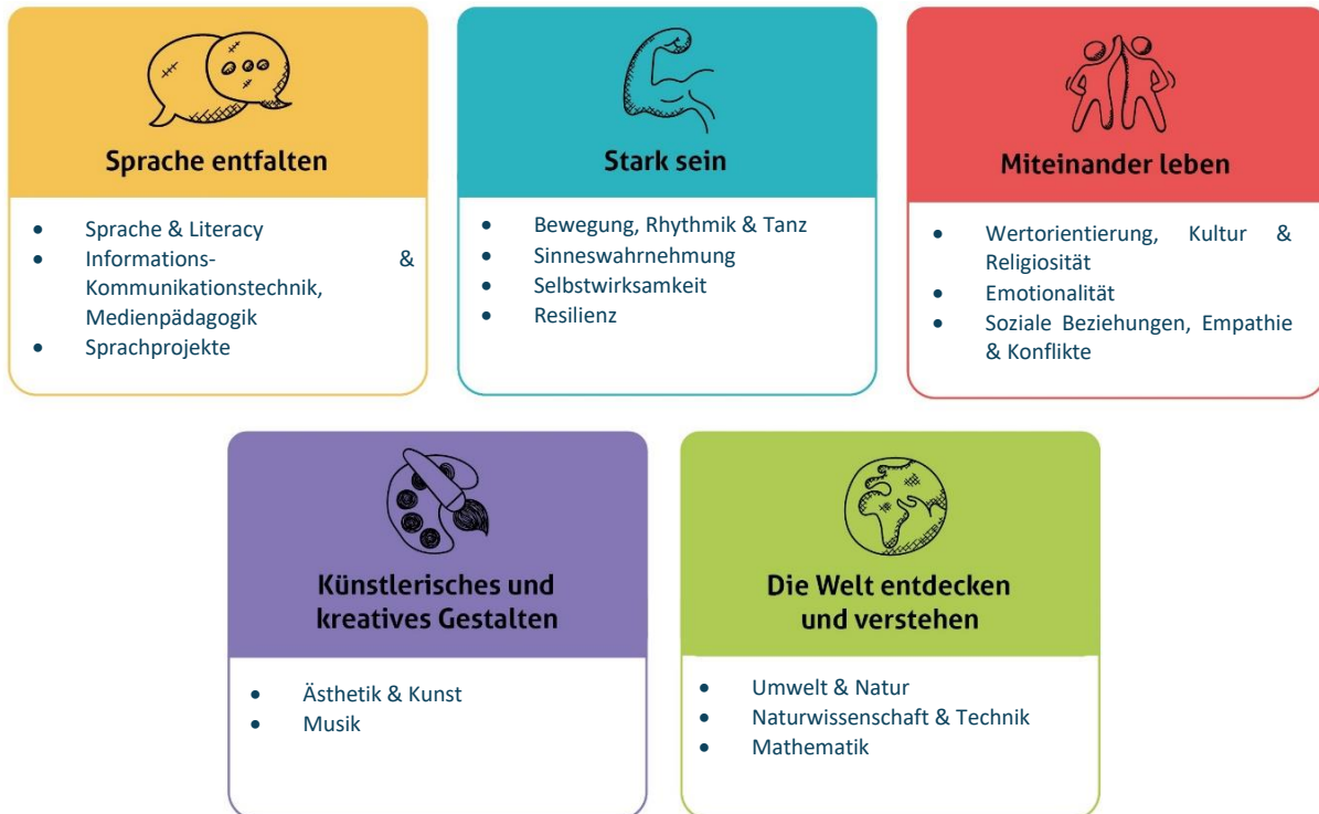
Abbildung 1: Die fünf Erfahrungsbereiche von Denk mit Kita für eine ganzheitliche Bildung

Wir sehen die Basiskompetenzen als Grundlage für weiteres Lernen. Sie dienen der Persönlichkeitsentwicklung und sind der Grundstein für die Interaktion und Auseinandersetzung mit anderen Individuen und unserer Umwelt. Die Basiskompetenzen werden im Kleinkindalter vorwiegend über Bewegung im freien Spiel und im Alltag entwickelt sowie durch eigene Erfahrungen und Erlebnisse gefestigt. Die Umsetzung der genannten Bildungs- und Erziehungsziele erfolgt durch unsere fünf Erfahrungsbereiche. So ist es uns möglich in unserer pädagogischen Arbeit alle Erfahrungsbereiche in der Woche aufzugreifen und ganzheitliche Bildung zu garantieren. Zudem können wir diese für die Familien in unseren Wochenplänen sichtbar dokumentieren. Die Bereiche dienen den Mitarbeiter:innen zur Orientierung und als Leitfaden für die Planung und Umsetzung vielfältiger Projekte. Nach dem Prinzip der ganzheitlichen Bildung stellen unsere fünf Erfahrungsbereiche ein vielfältiges Angebot dar, in dem unsere Kinder mit allen Sinnen und vollem Körpereinsatz die Welt erforschen dürfen.