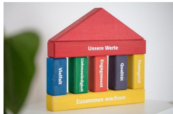
Bild: Unternehmenswerte von Denk mit Kita

Deswegen haben wir uns als Denk mit Kita nicht nur die Werte Engagement und Liebenswürdigkeit vorgenommen, die im Einflussbereich der einzelnen Person liegen, sondern auch den Wert Teamgeist, weil wir der Überzeugung sind, dass die Qualität unserer Arbeit nur im Team erhalten und ausgebaut werden kann. Ein gut funktionierendes, eingespieltes Team wiederum besteht aus engagierten und liebenswürdigen Teammitgliedern, die sich mit diesen Eigenschaften und ihren persönlichen Kompetenzen und Ressourcen eigenverantwortlich in das Team einbringen.