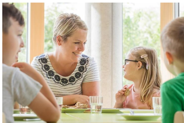
Bild: Pädagogin mit Kind

Wir nehmen uns Zeit für die Familien. Uns ist es wichtig, dass sich unsere Familien genauso wohl fühlen wie die Kinder. Der tägliche kurze Austausch und das persönliche Gespräch sollen Vertrauen schaffen und ihnen die Sicherheit geben, dass es ihrem Kind bei uns gut geht. Das Kind fühlt sich durch den engen Kontakt zwischen Familien und pädagogischen Fachkräften geborgen und es fasst Vertrauen in die neue Umgebung. So kann es mit Unterstützung des pädagogischen Fachpersonals seinen Platz in der Kindergruppe finden.