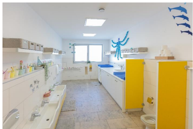
Bild 1 & 2: Außenbereich und Kinderbad unserer Denk mit Kita Trossingen

Im Flur- und Garderobenbereich sind die kindgerechten Garderoben der Kinder untergebracht und die Erzieher/-innen können im täglichen Betrieb ihre kleinen Schützlinge und deren Eltern in Empfang nehmen und mit diesen in den täglichen Austausch treten. Zusätzlich sind in diesem Bereich Infotafeln angebracht, an welchen die Eltern aktuelle Informationen unserer Einrichtung einsehen können.