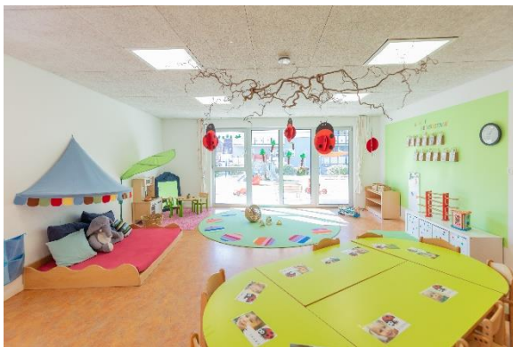
Bild 6 & 7: Raumgestaltung und Kinderbistro unserer Denk mit Trossingen

Unsere warmherzige Raumatmosphäre und die kindgerechte Gestaltung der Räume tragen wesentlich dazu bei, dass sich die Kinder wohlfühlen. Sich wohlfühlen, ist Grundlage optimaler Entwicklung.