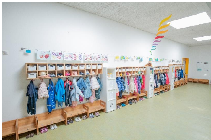
Bild 3: Flur- und Garderobenbereich unserer Denk mit Kita Trossingen

In unserem großzügigen Flur wird mit den Kindern regelmäßig geturnt. Dort können auch die Fische im Aquarium beobachtet werden. Jede Gruppe hat einen festen Turntag in der Woche, an dem die Gruppe den Flur mit Turngeräten, Klettermöglichkeiten, Matten und Bällen zu einer einladenden Turnlandschaft verwandelt und zum Bewegen einlädt.