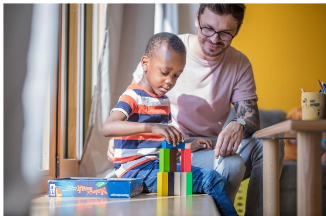
Bild: Pädagoge mit Kind in einer Denk mit Kita

Kinder zeigen schon sehr früh, welche Verhaltensweisen, Situationen, Personen oder Gegenstände sie besonders gernhaben. Diese individuellen Vorlieben zu beobachten und zu stärken, ist Aufgabe unseres pädagogischen Fachpersonals. Wir setzen Vertrauen in die kindliche Neugier und stärken die fragende Haltung der Kinder. Wir unterstützen die Kinder mit wertschätzender Bestätigung, mit emotionalem Rückhalt, mit praktischer Hilfestellung oder mit gezielten Hinweisen. Zudem können die pädagogischen Fachkräfte den Kindern wertvolle Impulse im Freispiel geben, um das Spiel der Kinder zu lenken und stärkend weiterzuentwickeln. Unsere Pädagogen sind Vorbilder bei Konflikt- und Grenzsetzungssituationen im sozialen Geschehen, an denen sich die Kinder im Spiel orientieren können. Jedes Kind signalisiert auf seine Weise, wie viel und welche Art der Unterstützung es benötigt. Jede Entwicklungsphase stellt einen wichtigen Zwischenschritt auf dem Weg zur