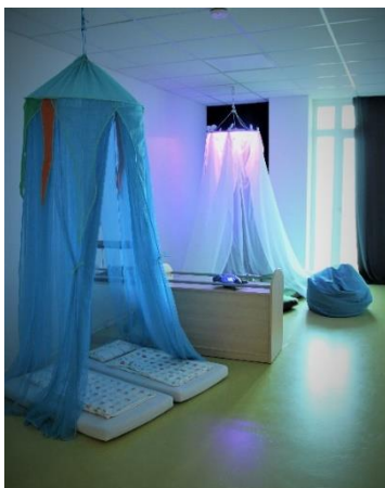
Stand August 2024

Direkt neben dem Gruppenraum befindet sich ein Nebenraum. Dieser kann in