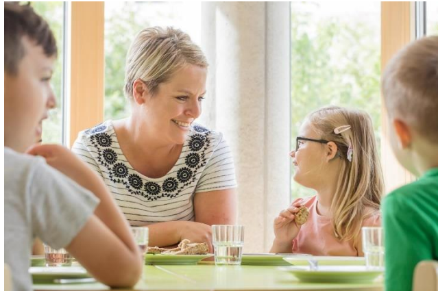
Bild: Pädagogin mit Kind

Wir nehmen uns Zeit für die Familien. Uns ist es wichtig, dass sich unsere Familien genauso wohl fühlen wie die Kinder. Der tägliche kurze Austausch und das persönliche Gespräch sollen Vertrauen schaffen und ihnen die Sicherheit geben, dass es ihrem Kind bei uns gut geht. Das Kind fühlt sich durch den engen Kontakt zwischen Familien und pädagogischen Fachkräften geborgen und es fasst Vertrauen in die neue Umgebung. So kann es mit Unterstützung des pädagogischen Fachpersonals seinen Platz in der Kindergruppe finden.