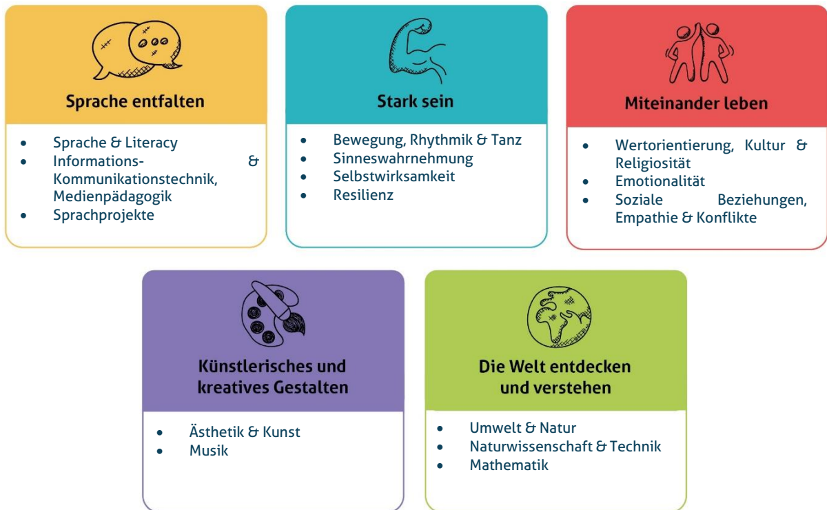
Abbildung 1: Die fünf Erfahrungsbereiche von MiniMax Kids Kita für eine ganzheitliche Bildung

Diese werden individuell auf alle Altersgruppen der von uns zu betreuenden Kinder angepasst und unter einem extra Gliederungspunkt näher beschrieben. Unsere Kita gestaltet durch vielfältige Angebote ein geeignetes Lernumfeld, damit unsere Kinder Basiskompetenzen erwerben und weiterentwickeln können.