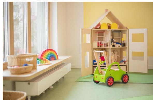
Bild 4 & 5: Beispielhafte Raumgestaltung unserer MiniMax Kids Kitas

Die räumliche Ausstattung und Ausgestaltung orientierten sich an den Bedürfnissen der uns anvertrauten Säuglinge, Kleinkinder und Kinder. Gemeinsames Spielen ist ebenso möglich wie vorübergehender Rückzug. Das Bedürfnis nach aktiver körperlicher Bewegung kann ebenso erfüllt werden, wie der Wunsch des Kindes nach Kontaktaufnahme zum