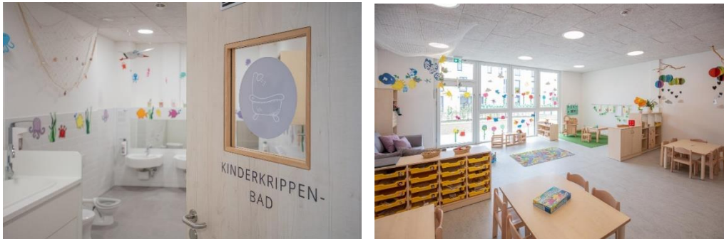
Bild 7 & 8: Kinderbad und Gruppenraum in der Denk mit Kita Vaterstetten

Der Krippenteppich „Circelino“ dient im Kinderkrippengruppenraum als täglicher Treffpunkt für den Morgenkreis. Auf seinen zwölf Punkten findet jedes Kind einen Platz und gemeinsam kann im Morgenkreis der Tag mit Fingerspielen, Liedern und dem gemeinsamen Zählen der Kinder begonnen werden. Unsere Gruppenräume sind so möbliert, dass die Kinder hier auch ihre Mahlzeiten einnehmen können. Hier ist es uns wichtig, den Kindern einen ruhigen ritualisierten Rahmen zu bieten, gemeinsam am Tisch zu sitzen und das Essen zu genießen.