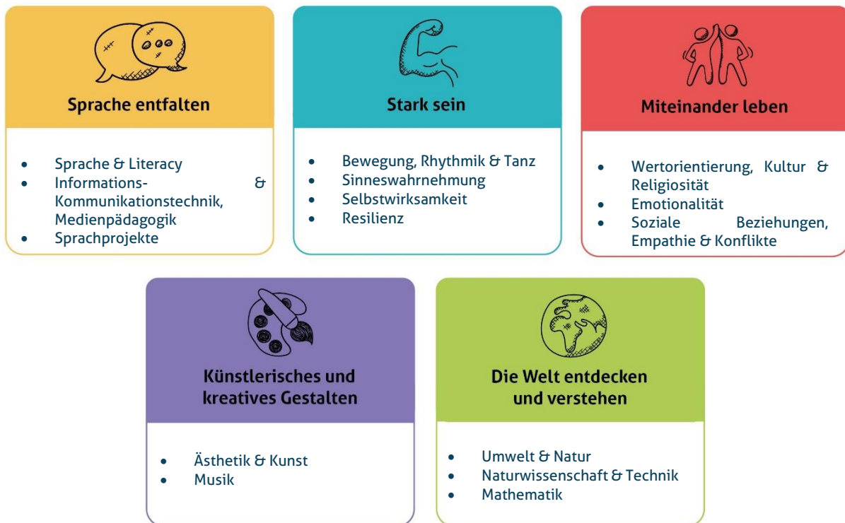
Abbildung 1: Die fünf Erfahrungsbereiche von Denk mit Kita für eine ganzheitliche Bildung

Wir sehen die Basiskompetenzen als Grundlage für weiteres Lernen. Sie dienen der Persönlichkeitsentwicklung und sind der Grundstein für die Interaktion und Auseinandersetzung mit anderen Individuen und unserer Umwelt. Die Basiskompetenzen werden im Kleinkindalter vorwiegend über Bewegung im freien Spiel und im Alltag entwickelt sowie durch eigene Erfahrungen und Erlebnisse gefestigt. Die Umsetzung der genannten Bildungs- und Erziehungsziele erfolgt durch unsere fünf Erfahrungsbereiche. So ist es uns möglich in unserer pädagogischen Arbeit alle Erfahrungsbereiche in der Woche aufzugreifen und ganzheitliche Bildung zu garantieren. Zudem können wir diese für die Familien in unseren Wochenplänen sichtbar dokumentieren. Die Bereiche dienen den Mitarbeitern zur Orientierung und als Leitfaden für die Planung und Umsetzung vielfältiger