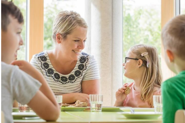
Bild: Pädagogin mit Kind

Wir führen in der Trennungsphase feste Rituale für das Kind ein. Das kann das tägliche Winken am Fenster sein, das Mitbringen eines vertrauten Spielzeugs, eines Kuscheltiers oder das Singen eines Liedes. Oft helfen auch unterstützende Dinge wie der Schnuller oder das Lieblingstuch, um den Übergang von Vertrautem zu Neuem zu erleichtern. Die Verabschiedung fällt dem Kind leichter, wenn sie kurz, aber trotzdem liebevoll ist. Auch vielen Familien fällt der Abschied schwer. Das persönliche Übernehmen des