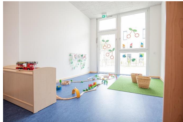
Bild 9 & 10: Kinderküche und Nebenraum der Denk mit Kita Vaterstetten

Unser großzügiger Garderoben- und Eingangsbereich bietet für Kindergarten und Krippe Gelegenheit, Eltern, Kinder und Geschwisterkinder in der Einrichtung willkommen zu heißen. Der Flur vor den Gruppenräumen kann ebenfalls als Raum zum Spielen, Krabbeln, Bewegen und gerade für unsere Kindergartenkinder auch für Begegnungen und Interaktionen zwischen den unterschiedlichen Altersgruppen genutzt werden. Aus hygienischen Gründen werden deshalb in diesem Bereich keine Straßenschuhe getragen.