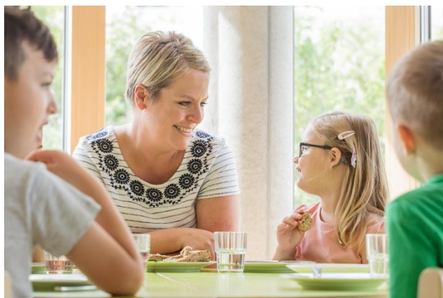
Bild: Pädagogin mit Kind

Wir nehmen uns Zeit für die Familien. Uns ist es wichtig, dass sich unsere Familien genauso wohl fühlen wie die Kinder. Der tägliche kurze Austausch und das persönliche Gespräch sollen Vertrauen schaffen und ihnen die Sicherheit geben, dass es ihrem Kind bei uns gut geht. Das Kind fühlt sich durch den engen Kontakt zwischen Familien und pädagogischen Fachkräften geborgen und es fasst Vertrauen in die neue Umgebung. So kann es mit Unterstützung des pädagogischen Fachpersonals seinen Platz in der Kindergruppe finden.