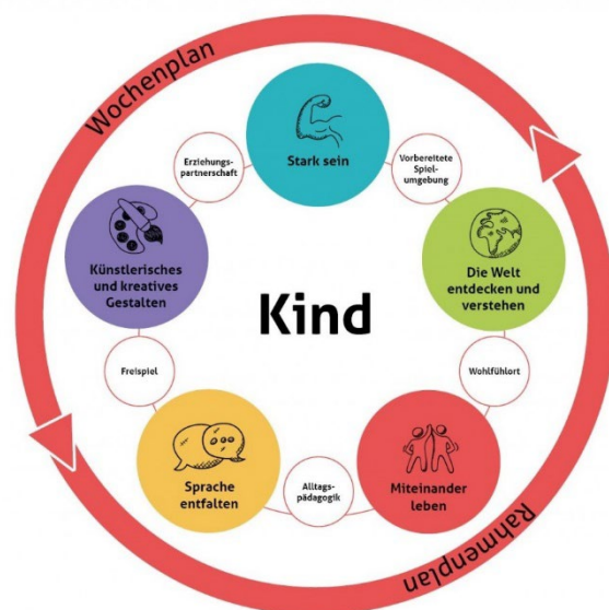
Abbildung 2: Pädagogik von Denk mit Kita

Wir betrachten das Kind als Akteur , der sich aktiv am Gruppengeschehen beteiligt. Das Kind wird in Situationen und Entscheidungen miteingebunden und beteiligt. Unsere Kinder sollen sich aktiv und selbstständig im Gruppenraum bewegen. Deshalb ist es in unserer Raumgestaltung wichtig auf die Perspektive des Kindes zu achten, damit es im Freispiel selbstständig und selbstbestimmt spielen kann.