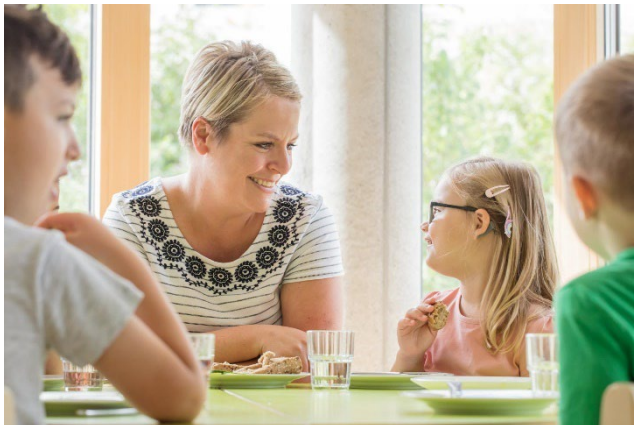
Bild: Pädagogin mit Kind

Nun kann die Zeit, in der das Kind allein in der Gruppe ist, langsam gesteigert werden. Ziel ist es, dass sich das Kind mit seinem eigenen Tempo auf die neue Umgebung, das pädagogische Fachpersonal und die anderen Kinder einstellen kann.